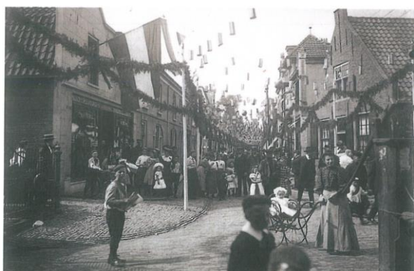
Leeuwenstraat 21-27. Op de linker foto uit 1903 zijn de nummers 23-27 nog in gebruik als woonhuis. Op de rechter foto zijn nummer 21 en 23 samengevoegd en verbouwd tot winkel.