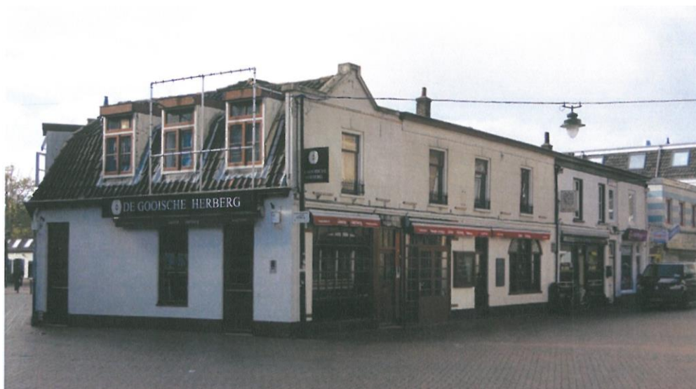
Leeuwenstraat 21-27, huidige toestand.

In de huidige toestand bevinden de panden Leeuwenstraat 21 t/m 27 zich in een weinig florissante toestand. Door achterstallig onderhoud, reclametoevoegingen en verwijderde elementen heeft het geheel een onsamenhangende uitstraling. Echter de bouwvolumes bevinden zich nog in de oorspronkelijke toestand. Hierdoor behoren de panden Leeuwenstraat 23-27 tot de oudere bebouwing van Hilversum. Leeuwenstraat 21 is in het derde kwart van de 19e eeuw toegevoegd. Door aanpassingen in de nakomende periode is dit bouwvolume in eenheid gebracht met de bebouwing van Leeuwenstraat 23-27. Hierdoor vormen de panden als geheel een herkenbaar restant van de oudere bebouwing in de dorpskern van Hilversum. In de achterliggende Kampstraat, Spoorstraat en aan de Groest bevinden zich eveneens nog enkele bouwvolumes van de oude dorpsbebouwing.