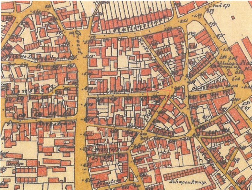
Kadastrale minuut uit 1905, na de bouw van het station is het gebied verstedelijkt.

Het pand Leeuwenstraat 21 kreeg vermoedelijk meteen bij de bouw of snel erna een winkel-woonhuis bestemming. In ieder geval is dit omstreeks 1900 het geval. Het pand had een winkelpui met een kleine portiek onder een stalen lateibalk. In 1907 is Leeuwenstraat 21 samengevoegd met Leeuwenstraat 23 en is de bestaande winkelpui verbreed richting nummer 23. Hierbij ontstond een symmetrisch geheel in Jugendstilvorm, met de portiek in het midden en aan weerszijden een breed etalagevenster. Deze pui is in de huidige bebouwing nog aanwezig. De Jugendstil indeling van de rechter etalage en de portiek zijn verwijderd. Bij deze verbouwing is ook de voorgevel aan de linker zijde opgetrokken en het geheel bepleisterd en van schijnvoegen voorzien om de voorgevel bij de voorgevels van Leeuwenstraat 23-27 aan te laten sluiten. De oorspronkelijke entree deur van Leeuwenstraat 23 is behouden gebleven. Het rechter venster op de begane grond is bij de verbouwing van 1907 aan weerszijden voorzien van een lager zijraam met kwartrond siermetsel- en tegelwerk erboven.