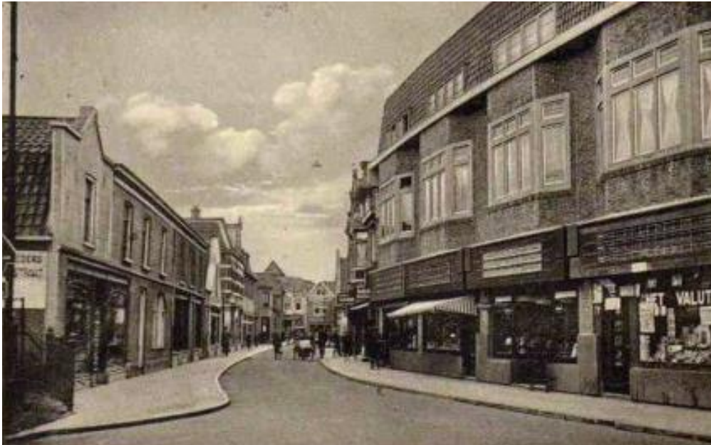
Leeuwenstraat 21-27 eind twintiger jaren. De panden zijn verbouwd tot winkel-woonhuizen. De boerderijen aan de overkant zijn vervangen door grootschalige nieuwbouw. Als gevolg van de geleidelijke verstedelijking is een staalkaart van architectuur ontstaan in de Leeuwenstraat.