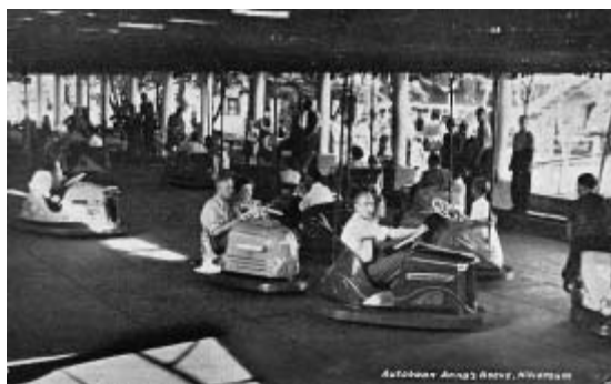
De "autobaan" was naast het spookhuis een van de populairste attracties van Anna's Hoeve.