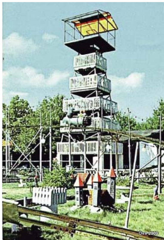
De speeltuin in 1965: de achtbaan en de uitkijktoren.

onbeheerd achter. De bootjesverhuurder kon dan fluiten naar het geld en moest als dank ook nog de boten ophalen! Toch dacht hij met een goed gevoel terug aan