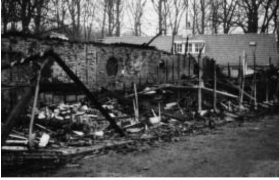
Een grote brand in 1972 liet weinig van het hoofdgebouw over.