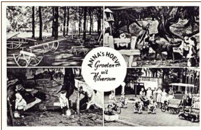
De speeltuin op een Ansichtkaart uit 1956. De attracties waren nog eenvoudig van aard.

die tijd: 'Menig jong stelletje kwam hier een tochtje maken' en 'Heel wat huwelijken zijn, denk ik, hierdoor tot stand gekomen'. De vijvers (volgens Martin Ros 'strontvijvers' vanwege de sterke stank) boden 's winters gelegenheid tot schaatsen. Menig Hilversummer heeft op Anna's Hoeve leren schaatsen.