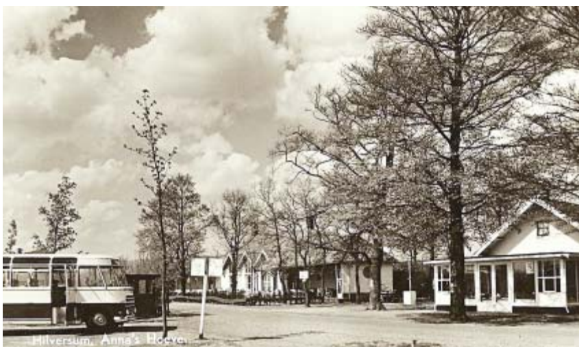
Ansichtkaart uit 1960 van de voorkant van de speeltuin. Geheel rechts het oorspronkelijke theehuis.