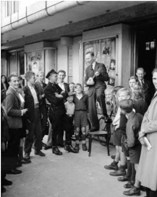
Een muzikant voor bioscoop Rex, 1946.