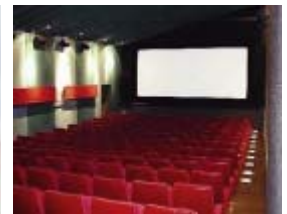
Eén van de zalen van Euro.

In 1972 werd de Casinobioscoop verbouwd tot twee bioscopen. Later zou er nog een derde bioscoop bijgeplaatst worden. De Eurobioscoop in 2005.