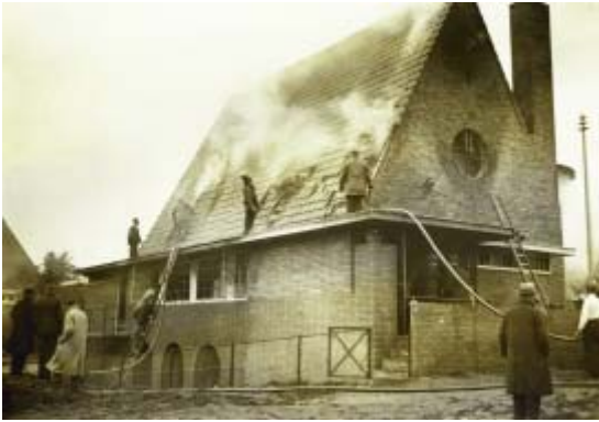
De filmbrand aan de Bosdrift in 1934.

York een geluidsinstallatie aan. Het bleef echter behelpen, niet alleen door de apparatuur, maar ook omdat de meeste zalen akoestisch niet ingericht waren voor deze techniek.