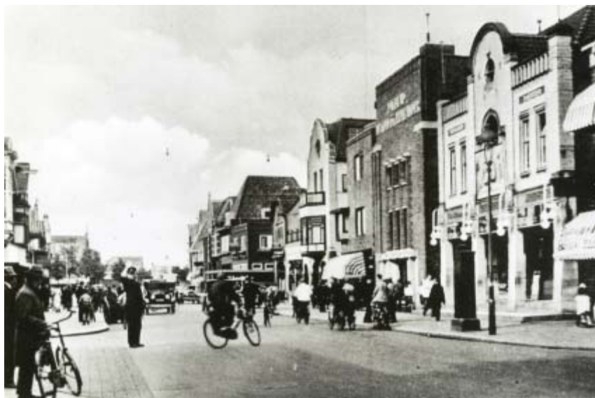
Het New York Bioscope Theater (1913) aan de Groest met links ernaast het gebouw van De Gooi- en Eemlander (1928). De foto dateert uit begin jaren dertig. De bioscoop werd in 1935 vervangen door Rex.

Het enthousiasme voor het nieuwe medium was groot, maar al snel kwamen er zorgen over de slechte effecten van de film. De politie, belast met toezicht, kon weinig anders doen dan waarschuwen. In maart 1914 2 vroeg de commissaris aan de burgemeester jongeren beneden de