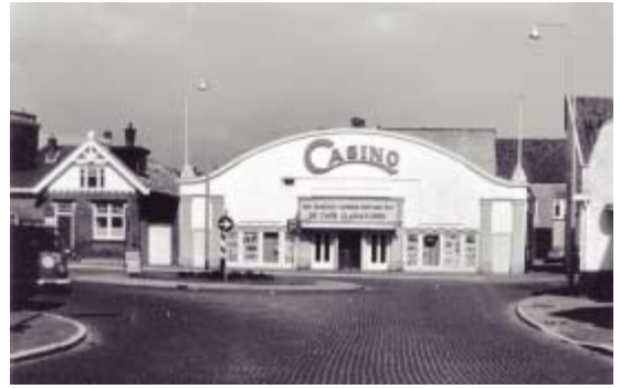
Het Casino-theater werd op 2 september 1927 geopend. Foto rond 1970, kort voor de verbouwing.

Lange tijd waren er plannen om te verbouwen. Die plannen namen vaste vorm aan begin jaren zeventig en konden echt goed aangepakt worden toen Joghem's in 1972 eigenaar werd. Het toneel dat nog steeds onder andere voor sinterklaasschoolvoorstellingen gebruikt werd, moest hiervoor verdwijnen. Wel waarschuwde de gemeente dat er in de toekomst andere plannen waren voor deze locatie, maar architect J.M. Jansen dacht dat dat nog wel vijf jaar kon duren. 8 De linkerzaal met 233 zitplaatsen bleef Casino heten, de iets kleinere rechterzaal kreeg de naam Euro. Die twee namen zijn nog steeds te zien in de nieuwe gevel – de mooie golf verdween – uit die tijd. Casino met zijn dieprode fauteuils zou zich blijven richten op actiefilms (seks, westerns etc.), terwijl Euro familiebioscoop werd. De stenen uit de kunstig gemetselde scheidingsmuur kwamen uit Joghem's eigen steenfabriek. 9 De projectie was geheel geautomatiseerd en voor de bediening was geen extra