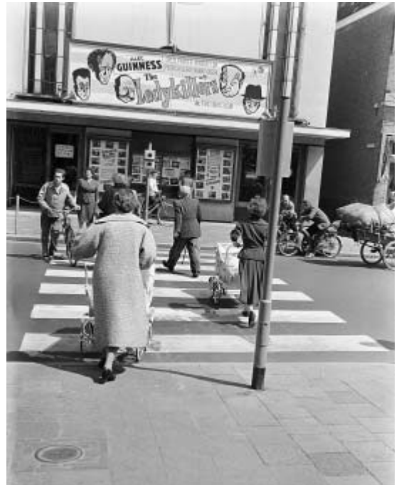
De Rex in de zomer van 1956.

Aan de Havenstraat verrees in 1920 een nieuwe bioscoop, naar ontwerp van J. van Dillewijn. Zaal, loge en balkon boden plaats aan 520 bezoekers, in 1927 werden dat er 590 door vergroting van het balkon. Tijdens de Tweede Wereldoorlog vond nog een verbouwing plaats en ook in 1947, toen de bioscoop inmiddels een nieuwe naam had. De nieuwe eigenaar was erg onder de indruk van het optreden van Churchill in de oorlog en vernoemde de bioscoop naar hem. Bij de laatste verbouwing kwam er meer comfort in de zitruimte, wat ten koste ging van het aantal plaatsen. Uiteindelijk had de bioscoop 420 zitplaatsen. Net als de andere bioscopen