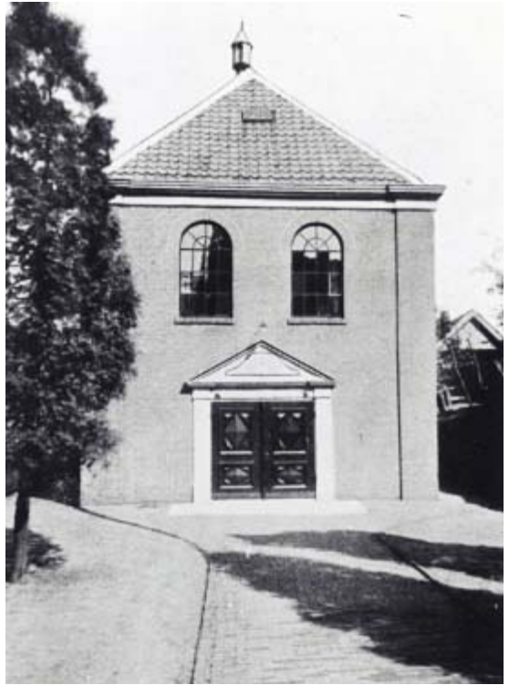
De joodse synagoge op de Zeedijk uit 1789 deed dienst tot 1942. In 1956 werd het pand omgebouwd tot zalencentrum en bioscoop Fiësta. Sloop van het pand volgde in 1969. Foto uit 1920.

Een nieuw initiatief was ook Fiësta in de voormalige synagoge aan de Zeedijk. De Gooi- en Eemlander berichtte op 11 oktober 1956 hierover: Het is de bedoeling aan deze vijfde bioscoop het zogenaamde studiokarakter te geven, dat wil zeg-