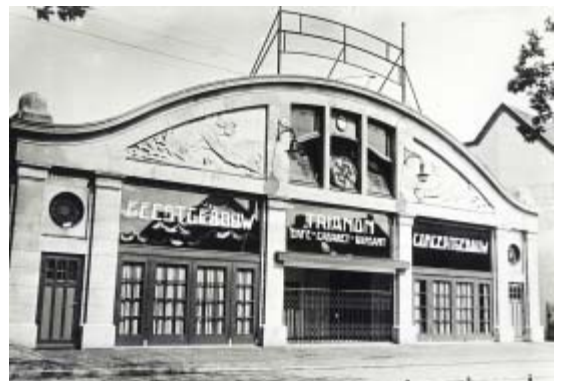
Feestzaal en concertgebouw Trianon rond 1926, kort voor de verbouwing tot Casino (nu Euro).

De gemeente voer wel bij het succes van de film. Zij inde 20% vermakelijkheidsbelasting over de toegangsprijzen. In september 1921 besloot de gemeente deze belasting te verhogen naar 40% en de gevolgen waren ingrijpend: op 12 september sloten alle bioscopen, theaters en sportinstellingen de deuren. Uiteindelijk haalde de gemeente bakzeil en draaide de verhoging terug. De Hilversumse bevolking was maar liefst drie maanden ver-