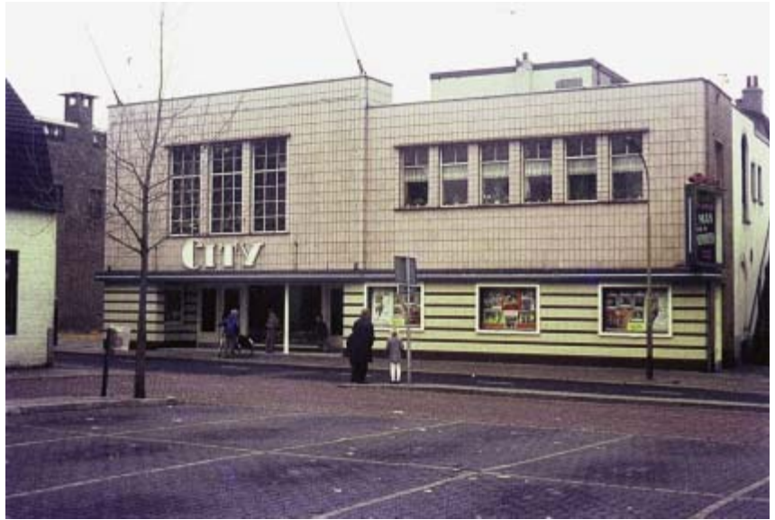
City-bioscoop in 1969.