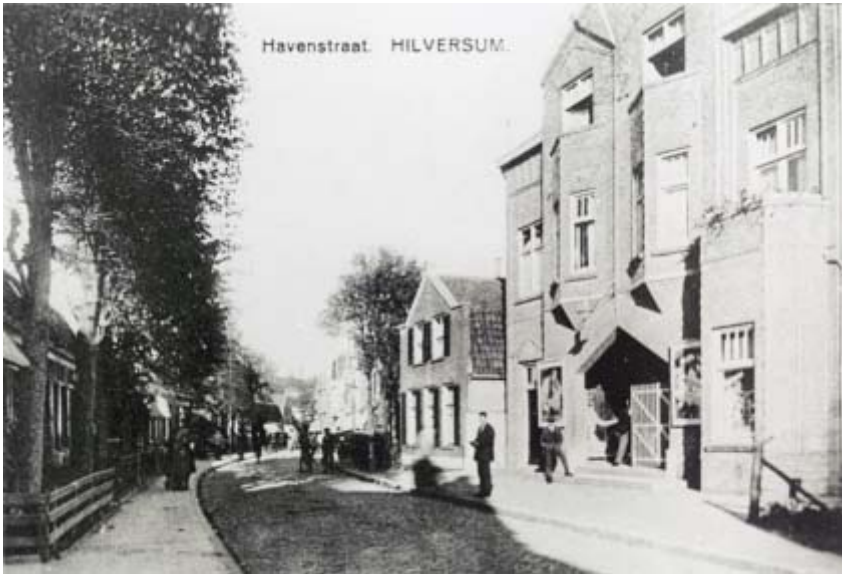
De Flora-bioscoop aan de Havenstraat voor de Tweede Wereldoorlog.

17 jaar de toegang tot de bioscoop te verbieden. Het rapport bevat enkele bevindingen: films in strijd met openbare zedelijkheid, maar mise en scene zo handig dat strafrecht niet van toepassing is. Er waren moorden en moordaanslagen te zien, afstropen van huid om vingerafdrukken te vervalsen en verheerlijking van chantage. In de zaal steeds vele jeugdige personen, zelfs kinderen en groot gejuich steeg op zoo dikwijls een moordenaar of dief aan de handen der politie wist te ontkomen. Al snel daarna werd een gemeentelijke bioscoopcommissie geïnstalleerd, die voorafgaand aan vertoning de films moest keuren. De door de politie gevraagde leeftijdsgrens kwam er, maar naar voorbeeld van Rotterdam werd dit vanaf 16 jaar. De commissie moest dus vaststellen of een film voor iedereen toelaatbaar was of alleen vanaf 16 jaar.