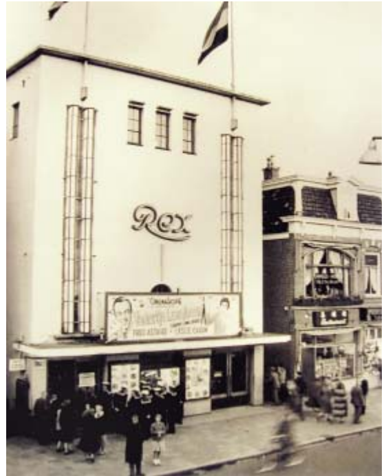
In 1935 werd het New York-theater opnieuw gebouwd naar ontwerp van architect C.M. Bakker en omgedoopt tot Rex. Foto september 1955. (coll. Krijn Brouwer)

Voor de oorlog gaven de distributeurs voor elke film ook een programmaboekje uit, waarin de plot werd samengevat en de hoofdrolspelers genoemd, zoals de Chaplinfilm Modern Times uit 1936. (coll. auteur)