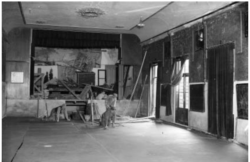
Verbouwing in 1941 van het Centraal Theater (voorheen De Harmonie) aan de Herenstraat tot City-bioscoop.