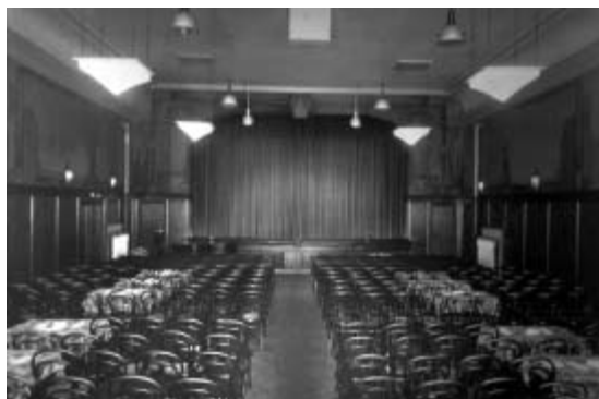
De grote zaal van Hotel Jans, waar in de begintijd bioscoopvoorstellingen werden gehouden. (coll. Percy Poolman)

in totaal 91 en daarvan nam het Concertgebouw aan de Herenstraat er 45 voor zijn rekening. De projectoren waren nog mobiel in die tijd en de eigenaars van de apparatuur reisden het hele land af om de films te vertonen. Een vaste plek hiervoor was de kermis, waar vanaf het begin het bewegend beeld een van de belangrijkste attracties was. In 1907 was de bioscoop ongekend populair: er stonden toen maar liefst vijf bioscopen op de Hilversumse kermis. Het jaar ervoor stond Hommerson et Fils niet op de kermis maar in Concertzaal Jans. Van reguliere filmvoorstellingen was in Hilversum pas sprake in 1910