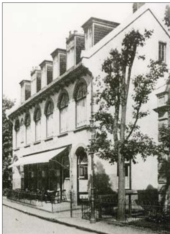
De Harmonie (1905) aan de Herenstraat, later verbouwd tot City-bioscoop.