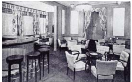
Bar „Zomerdijs Bussink“