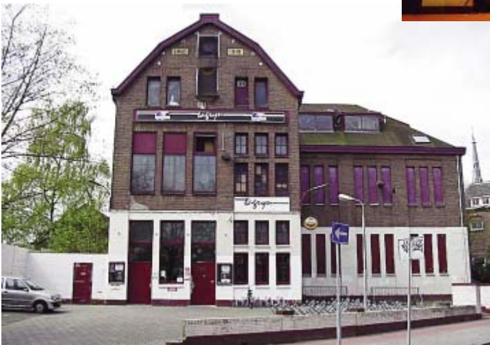
Jongeren centrum Utopia in Ons Gebouw aan de Havenstraat zat samen met jongeren centrum De Fietsenstalling (aan het Stationsplein, naast Café Bos) in een stichting. In 1974 werden beide jongeren centra ondergebracht in De Tagrijn aan de Koninginneweg, een gebouw dat eerder in gebruik was geweest bij de KWJ, de Katholieke Werkende Jongeren, onder de naam Dukdalf. Jongeren centrum De Tagrijn stond vooral bekend om zijn drugscultuur en vele optredens van bands, maar er werd ook veel gedaan aan vorming en creativiteit. Ook dit gebouw is gesloopt en vervangen door De Vorstin.