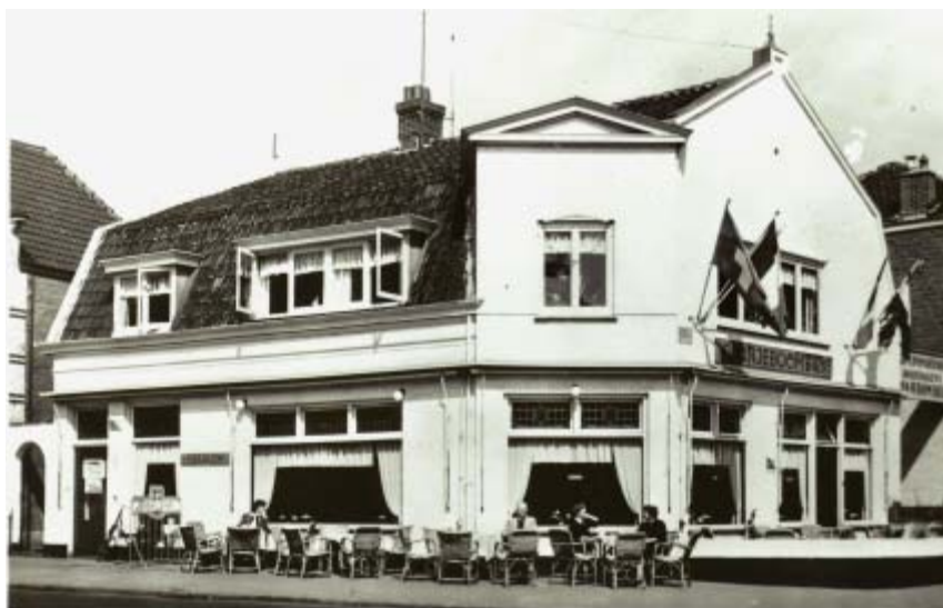
De Groest maar op. Op de hoek van de Herenstraat café Bus. Oorspronkelijk gebouwd als melksalon! Later werd dit jongerencafé Flater, beroemd en berucht in het Gooi en daarbuiten. Tegenwoordig worden hier vooral hamburgers verkocht.