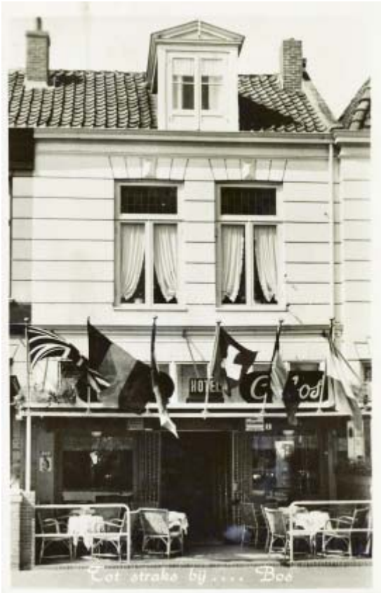
'Tot straks... bij Bos' aan het Stationsplein. Het café maakte veel reclame in de bioscoop. In de jaren zeventig en tachtig was het vooral een jongerencafé, evenals het ernaast gelegen Café Biersma. Ook bij Café Bos vonden regelmatig live-optredens plaats.