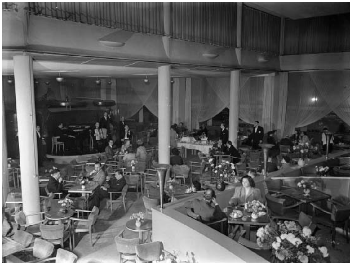
Weer verderop aan de Langestraat: uitgaan op stand in het café van Hotel Gooiland. Daar speelde in 1948 nog een bandje. In de jaren '70, '80 en '90 was in de kelder van dat pand discotheek Scaramouche. Het pand is inwendig een aantal keren flink verbouwd.