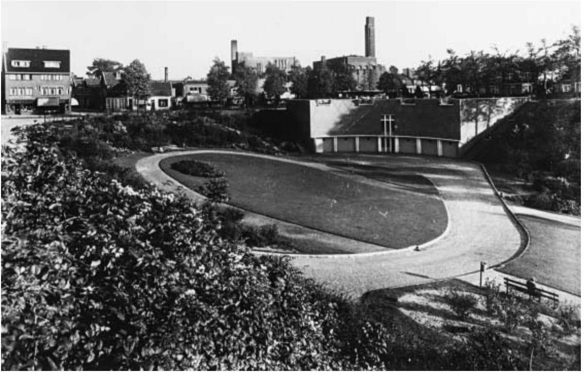
De 'Oude Haven' met zand- en zoutbunker, gebouwd door Dudok in 1941. Zowel links als rechts van de zand- en zoutbunker waren steile, stenen trappen. Daar kon je, als geoefende waaghals, ook met de slee vanaf maar dan moest het wel heel flink gesneeuwd hebben, terwijl het dan toch nog 'vrij link' bleef. In de zand- en zoutbunker zit nu een handel in tropische- en subtropische vissen, de Rifwachter.