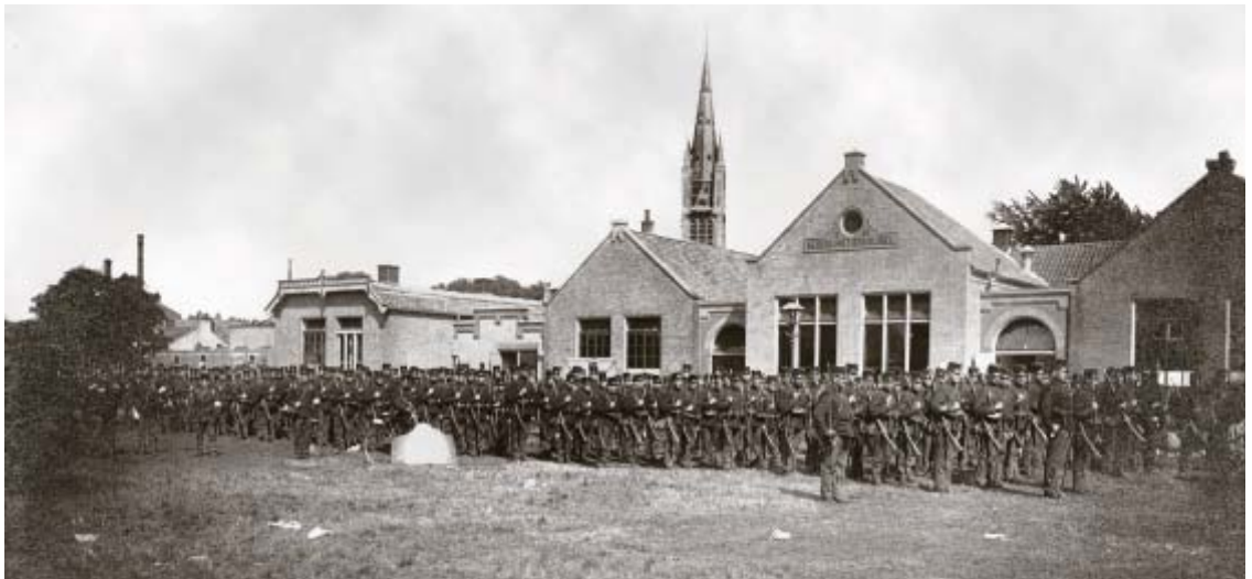
De protestants-christelijke Wilhelminaschool aan de Koningsstraat, geopend op maandag 3 maart 1884. Als lagere school gesloten in 1955 en afgebroken rond 1957. Dit is mijn lagere school. Rechts op de foto was de 'kleuterafdeling', in het middelste gedeelte zat wat men tegenwoordig de 'middenbouw' zou noemen en links de 'bovenbouw'. In het achterste gedeelte bevond zich 'de gymzaal' annex het speellokaal met een krakende, houten vloer. Heel wat splinters zijn daar uit kindervoetjes gehaald. De lantaarnpaal voor het middelste gedeelte van de school stond er na de Tweede Wereldoorlog nog steeds. Maar hij was uit deze optiek toen niet meer zichtbaar, omdat de voorgrond bebouwd was met onder meer het glasbedrijf van de firma Motshagen, dat nu op de Nieuwe Havenweg is gevestigd. Precies achter de lantaarnpaal hing de schoolbel aan de buitenmuur. Een schoolplein was er nauwelijks, zodat we tijdens de pauzes de Koningsstraat overstaken en tot halverwege het Eikbosserpad mochten spelen, bij de eerste ingang van het nieuwe gedeelte van de R.K.Z. In 1955 werd deze school gesloten en verhuisden we naar de spiksplinternieuwe Wilhelminaschool onder aan de Gijsbrecht van Amstelstraat, dicht bij het Laapersveld.