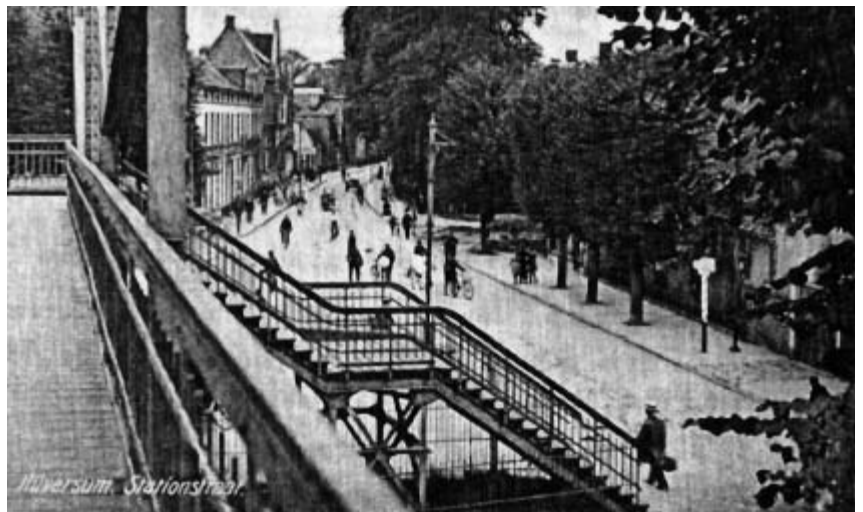
De voetgangersbrug over het spoor. Het ultieme genot van een Hilversumse jongen was om in de rook te gaan staan van onder je door rijdende stoomlocomotieven. Het stonk! Je werd even wat warmer en zag niets. De spanning om zo'n groot metalen monster onder je door te voelen rijden was enorm. Het bezorgde je een soort overwinningsgevoel. Bij thuiskomst stonk je echter nog steeds, dus mocht je dit de volgende keer niet meer doen! Ook het uitzicht vanaf deze voetgangersbrug was interessant. Het station, de Stationsstraat, het Stationsplein en de remise van de Gooise tram aan het begin van de Larenseweg kwamen goed in beeld.