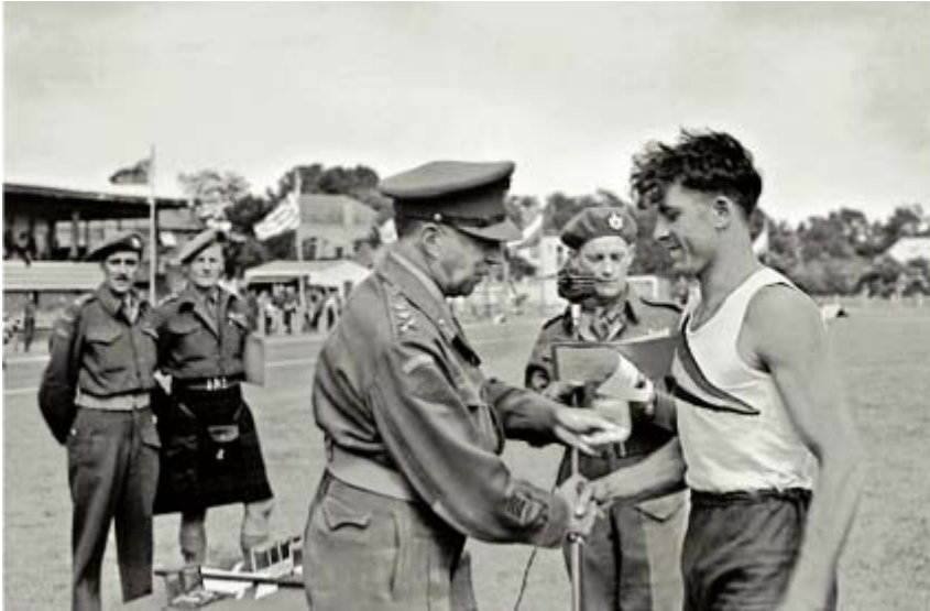
Op het Sportpark Hilversum werden op 20 juni 1945 prijzen uitgereikt aan militairen die mee hadden gedaan aan een sportmanifestatie. De stenen tribunes werden later bijgebouwd.