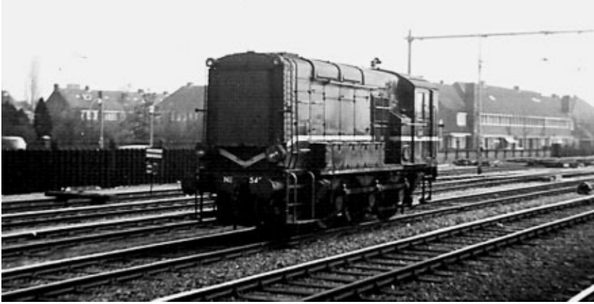
Hilversum, 6 april 1963. De rangeerloc 600 is op eigen kracht van Utrecht naar Hilversum gereden (aankomst 12.35) om een 2400 op te halen die uit Naarden-Bussum kwam. Op deze zaterdag was dat loc 2523, die als trein 8821 in Hilversum arriveerde. Het duo vertrok om 13.20 met 30 km/uur naar Amersfoort.