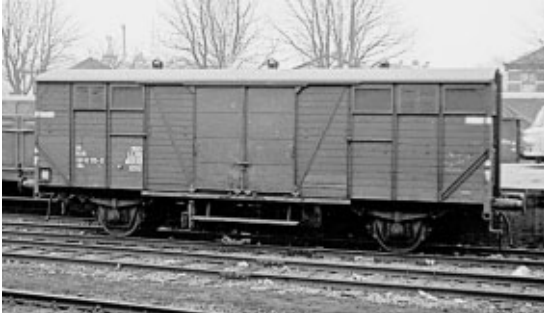
Van Gend & Loos-wagen, type GIs, nummer 208413301150. Deze wagens waren op afstand herkenbaar aan de gele banden op de hoeken. Ze werden dan ook “geelbanders” genoemd.

dam gesleept (spoor 3, 20.30 uur). De ‘Nord-West-Express’ naar Kopenhagen en Stockholm komt 7 minuten later door over spoor 2.