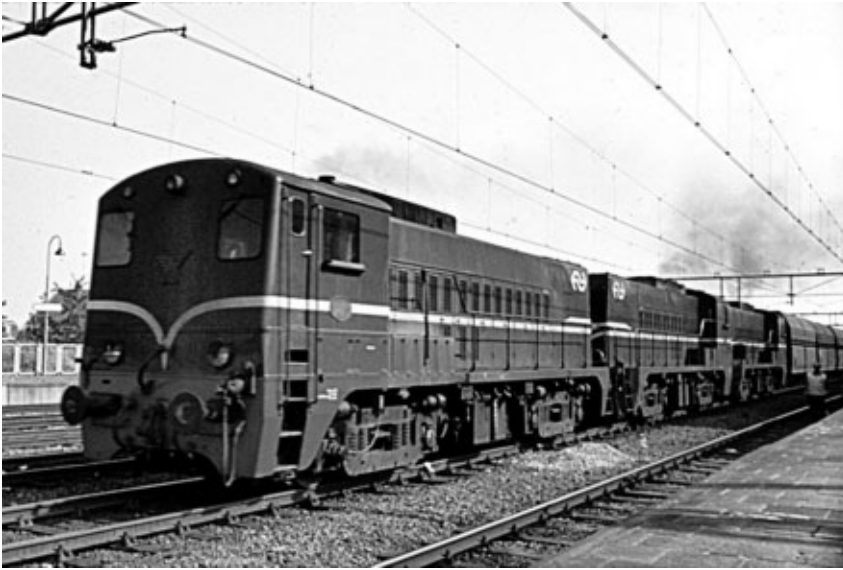
Driespan 2200'en met een ertstrein richting Amsterdam. Deze ertstreinen reden aanvankelijk met drie diesellocs. Om mee te kunnen komen met het intensievere treinverkeer werd er later een vierde loc aan toegevoegd.

na binnenkomst onmiddellijk tegen de goederentrein op spoor 6a en trekt zich weer op spoor 6b terug, zodat de 2400 aangekoppeld kan worden. Om 04.10 uur moeten het koppelen en de remproef achter de rug zijn, want dan moet deze goederentrein naar Lunetten vertrekken.