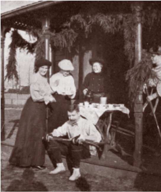
Hockeys van de HMHC voor hun eerst clubhuis aan de spoorlijn naar Bussum.

sticht die 'De Corvers' heet en die het korfbal in Hilversum levend houdt.