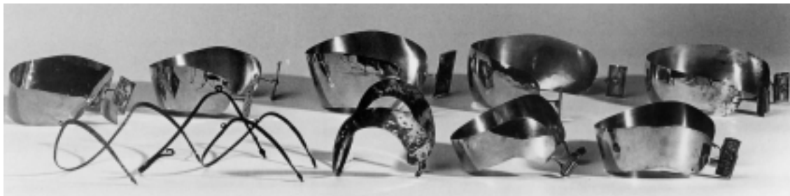
Oorijzers in Noord-Holland door de eeuwen heen. Op de voorste rij van ca. 1580 tot 1796 en daarachter van 1813 tot ca. 1900.

noemd. Dat laatste betekent ongeveer hetzelfde als biersteker: hij voorzag tappers van van buiten ingevoerde bieren. De herberg annex tapperij van buurman Bitter zal door hem bevoorradt zijn.