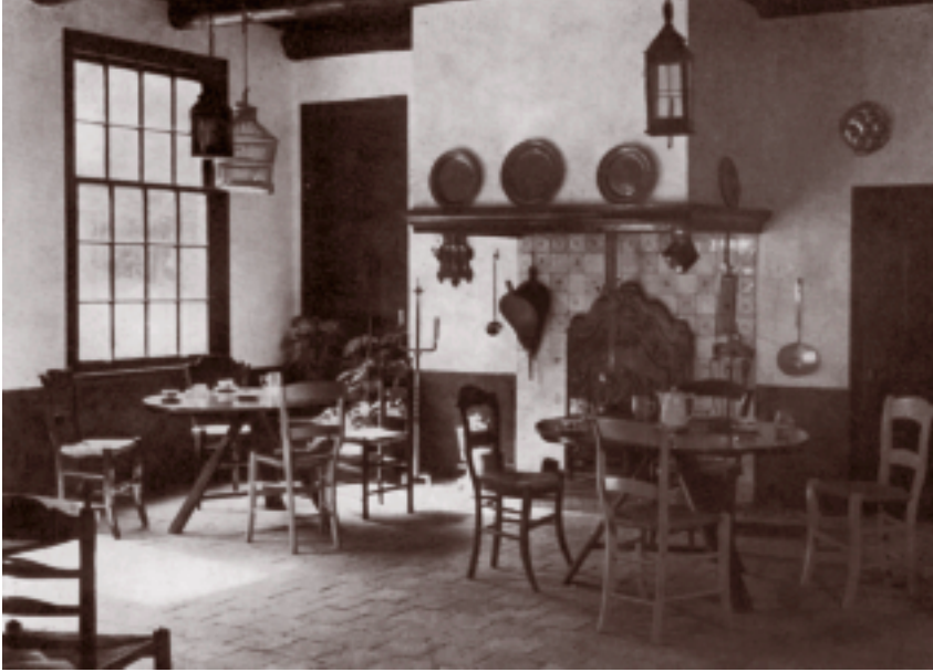
Interieur van een 18 e eeuwse herberg.