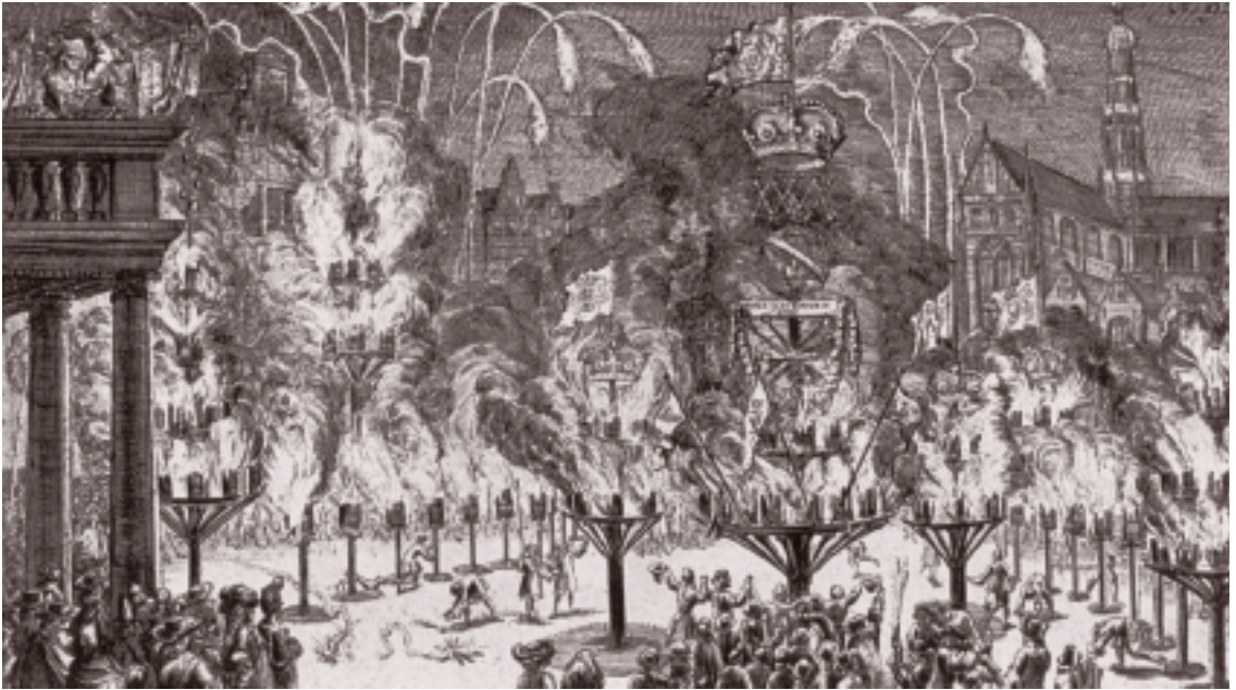
Vreugdevuur en vreugdeschoten waren vroeger bij feestelijke gebeurtenissen, zoals de herinstallatie van schout Bitter op 9 juni 1717, heel normaal. In sommige gevallen, zoals hier in Haarlem ter gelegenheid van de kroning van de stadhouder tot koning Willem III van Engeland op 21 april 1689, werden de festiviteiten afgesloten met een groot vuurwerk. Tekening Romein de Hooghe.

ge in de jaarrekeningen op grond van hetgeen bepaald was in 1658 en 1664. 9 Naar aanleiding van gerezen problemen waren in 1658 de regels omtrent de vaststellen, bewaren en inzage van de dorpsrekeningen vastgelegd en in 1664 regels met betrekking tot leges en vergoedingen van het dorpsbestuur. Het was dus niet de eerste keer dat het dorpsbestuur op z'n minst de schijn van zelfverrijking had. Bitter had vermoedelijk al jaren een tapperij bij zijn woning. De ruzie met De Swart had plaatsgevonden in de regtkamer ten huize van Jan Bitter. Het staat in de akte alsof dit een volkomen logische plek was voor vergaderingen en werkzaamheden van het dorpsbestuur. Uit de resolutie blijkt dat het rechthuis daartoe ook niet uitgerust was. De Heeren Staaten van Holland en Westvriesland bepaalden dat soo ras het Regthuis door de Ingezeetene soude zijn gemaakt en geappropriëert soodanig dat het bequaam was, om tot een ordentlyk Regthuis te kunnen dienen, alsdan alle de Besognes en Vergaderingen over Dorpssaaken op het Regthuis souden moeten werden gehouden. Een andere klacht was dat Bitter 14 mei 1721 had gekregen een consent om, met uitsluiting van alle andere, binnen den Dorpe Hilversum het Zout als kleine Kraamer te moogen verkoopen voor de tyd van