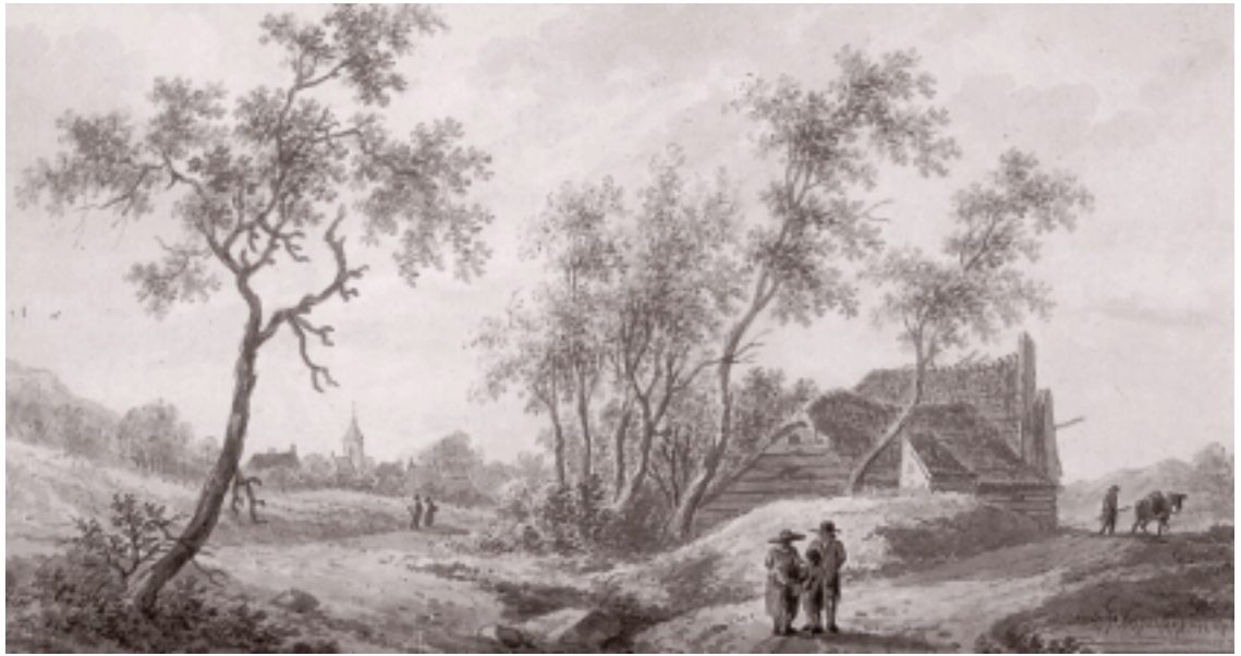
Gezicht op Hilversum in de 18 e eeuw. Aquarel van N. Wicart. (coll. Museum Hilversum)

stond aan de Kerkstraat. De buurman van Willem Clement, Anthonij Schrijffer, moet op nummer 98 gewoond hebben, of liever nummer 97, want 98 lijkt uit de omschrijving, huijs of stal , op een bediendenwoning te wijzen. In 1732 was schout Harmen Bouman, die Jan Bitter was opgevolgd, eigenaar van de nummers 97 en 98. Afgaande op de te betalen verponding hadden de panden een meer dan gemiddelde grootte. Gemiddeld brachten in Hilversum de huizen f3,74 op. Voor de nummers 100, 99 en 97 was dat respectievelijk f8,35, f8 en f7,40. Voor het tussenliggende huis of stal moest 1 gulden betaald worden.