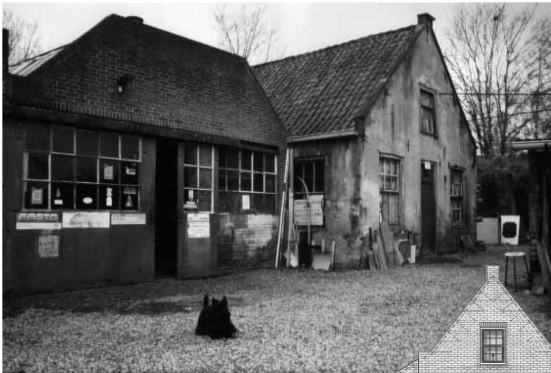
Was: Laanstraat 20-22 – straks Nieuwe Laanstraat 10. Van oorsprong een 18e-eeuws middelgroot stadshuis waar twee gezinnen in woonden. Het pand was verbonden aan de 'Winkel van Calis' door middel van een later aangebouwde werkplaats. Boven de deur heeft jarenlang het bord 'onbewoonbaar verklaarde woning' gehangen.