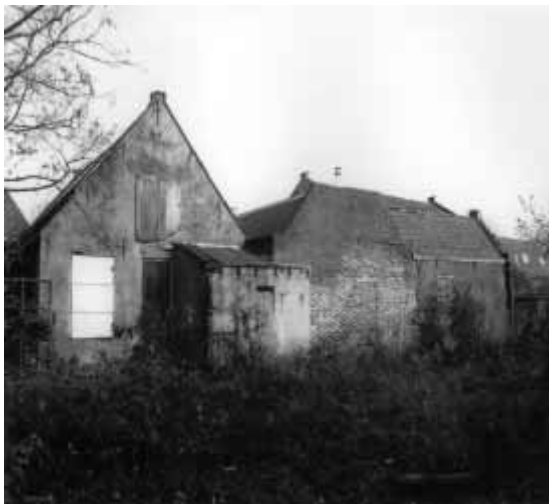
Achterzijde Nieuwe Laanstraat 10.