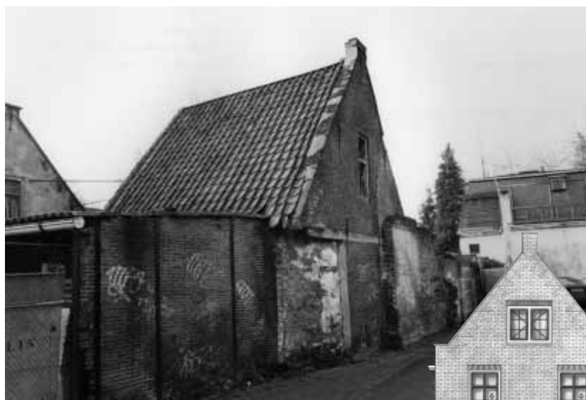
Was: Laanstraat 14 – straks: Nieuwe Laanstraat 12. Dit 18e-eeuws wevershuisje was eigendom van Hilversum Pas Op! Het eindigde zijn vroeger bestaan als opslagruimte op het terrein van Calis. Na restauratie wordt het een unieke, kleine, geriefelijke woning in het hart van het Historisch Buurtje.