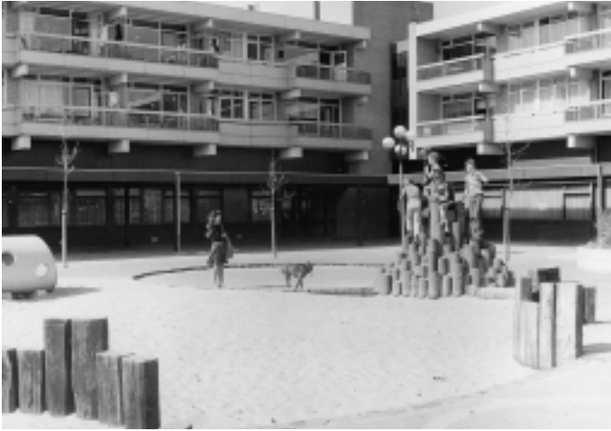
De speelplaats op het binnenplein van 'De Haak' in april 1976.