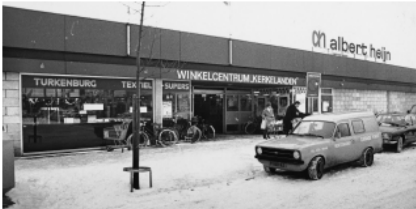
Het winkelcentrum, vlak voor kerst '81, gezien vanaf het parkeerterrein aan de 'achterzijde'.