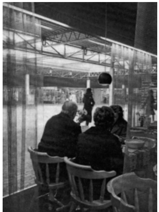
Vanuit coffee-corner Siësta konden (en kunnen) de voorbijgangers op het centrale plein worden bekeken. (uit: Wij in Hilversum )