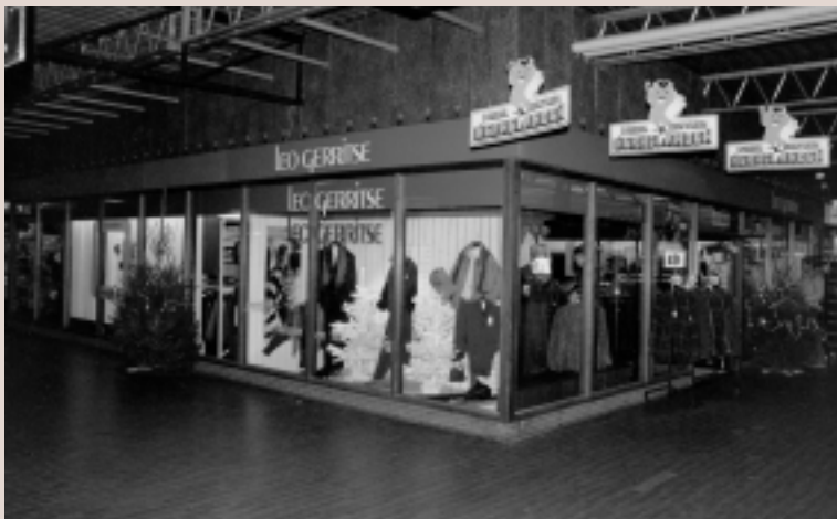
Hoewel op deze plaats in de oorspronkelijke plannen een baby-speciaalzaak stond gepland, werd het uiteindelijk de heren- en jongensmodezaak van Leo Gerritse.

Het oogt na meer dan 32 jaar nog steeds modern.