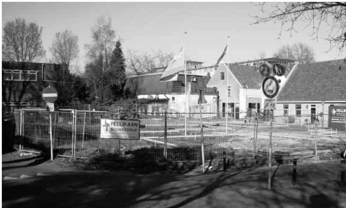
De tweede fase van het Laanstraatproject is van start gegaan.

Kenmerkend voor de uiterlijke verschijningsvorm van het voormalige fabrikershuis aan de Groest is de centrale deurpartij met kloeke omlijsting en fraaie geprofileerde deur. Bij de nieuwe indeling van het huis is er bewust voor gekozen om deze centrale deurpartij weer functioneel te maken. Behalve de opmetingste-