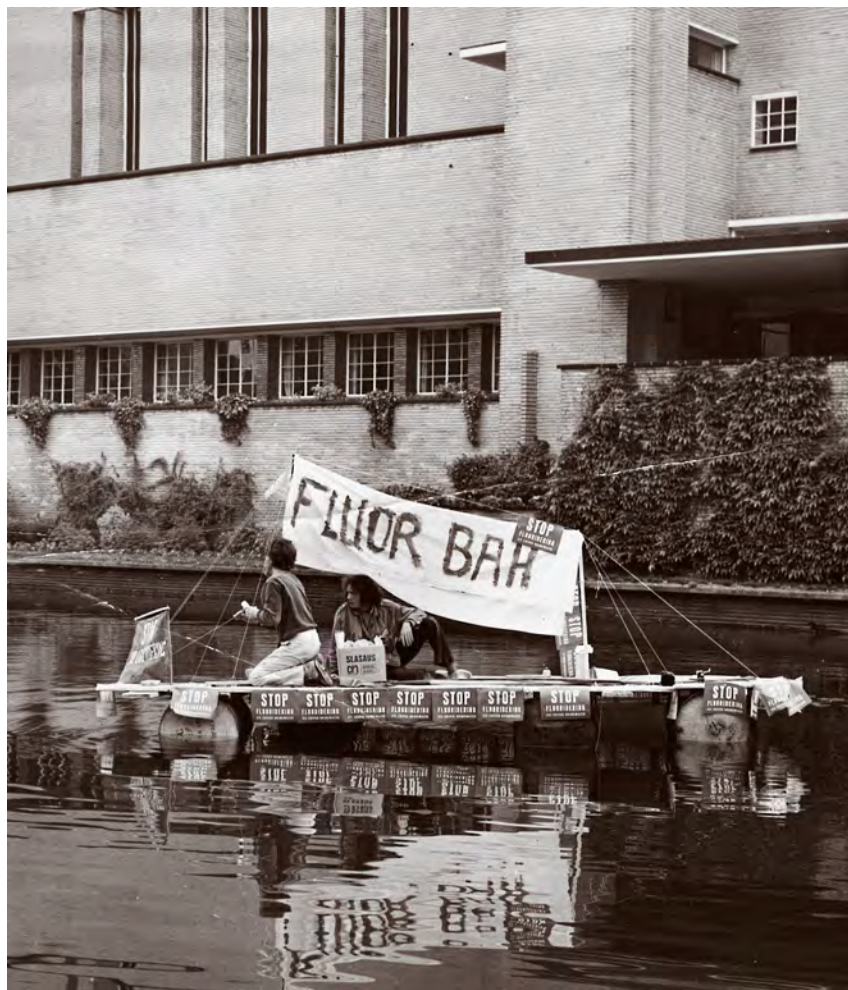
Een ludieke actie in de vijver van het Hilversumse raadhuis.

Het water dat door de pomp aan de Rembrandtlaan wordt geleverd, is vaak van een grijsachtige kleur en op het water constateerde men meerdere malen een vetachtige substantie. Zeer dienstig zou zijn indien U dit door een onpartijdig laboratorium zou willen doen onderzoeken, met het oog op de diepte vanwaar het water wordt opgepompt, en op bacteriologische- en andere kwaliteiten van het door deze pomp geleverde water.