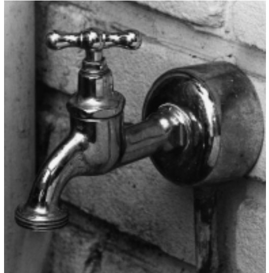
Van 15 mei 1968 tot 14 november 1970 werd er fluor toegevoegd aan het Hilversumse leidingwater.

De gemeente maakt daarop bekend dat er een leiding met een kraan wordt aangelegd tot buiten het hek van het WMN-pompstation aan de Larenseweg. Hilversummers kunnen voor een bepaald bedrag per jaar een sleutel krijgen van de