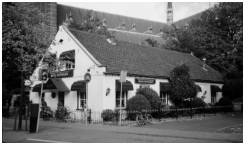
Emmastraat 9.

Om brede aandacht te vragen voor de boerderij heeft de Stichting Historisch Boerderijonderzoek te Arnhem in 1998 besloten dit jaar met publicaties, met CD-ROM(s), kalender, tentoonstellingen, wandel- en fietstochten en tal van