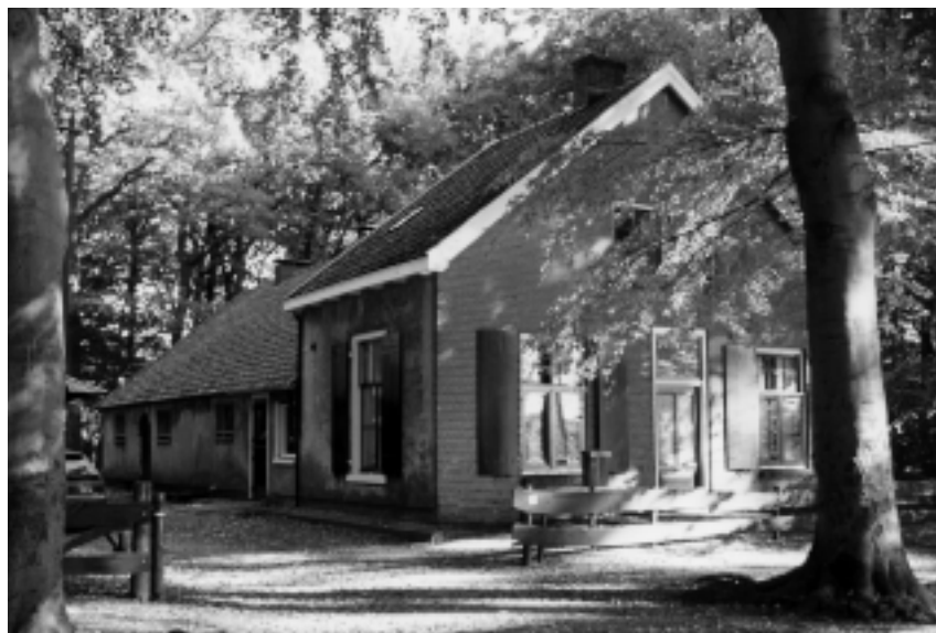
Boerderij in het Conversbos aan de Converslaan 20.

In deze inventarisatie zijn tien boerderijen terug te vinden, de boerderijen van