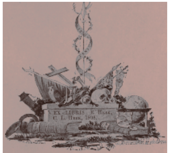
Het ex-libris van vader en zoon Heek. (coll. Goois Museum)

In 1934 werd het Museum voor het Gooi en Omstreken ge-