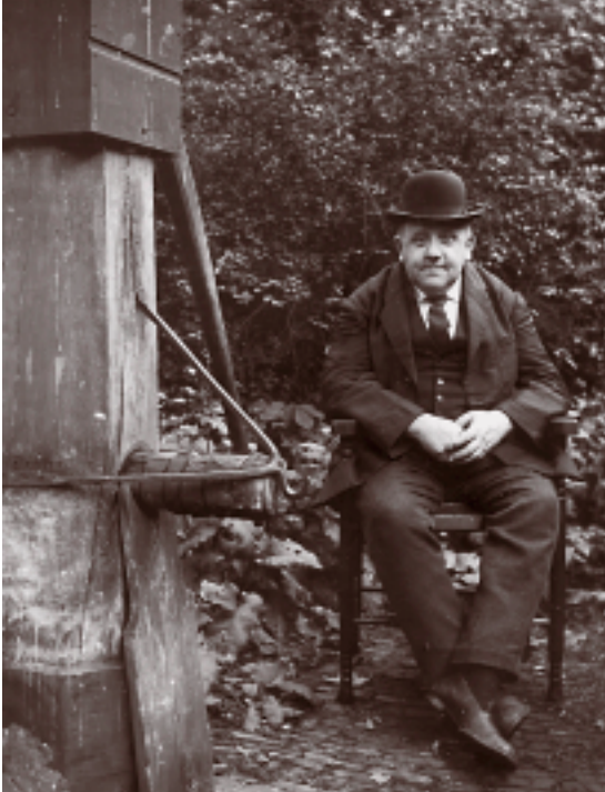
Bekende foto van de boekhandelaar bij de pomp achter zijn huis, altijd gekleed in een luster jasje en immer vergezeld van zijn onafscheidelijke bolhoed. (uit: Wij in Hilversum )

boekje voor Geschiedenis en Plaatsbeschrijving samen. Het bevatte diverse bijdragen. Heek zelf schreef over De opkomst van de tapijtfabrieken te Hilversum in de tweede helft van de 18 e eeuw . In het tweede jaarboekje, dat nooit is verschenen, beloofde Heek de Hilversumse industrie in het eerste kwart van de negentiende eeuw te zullen behandelen.