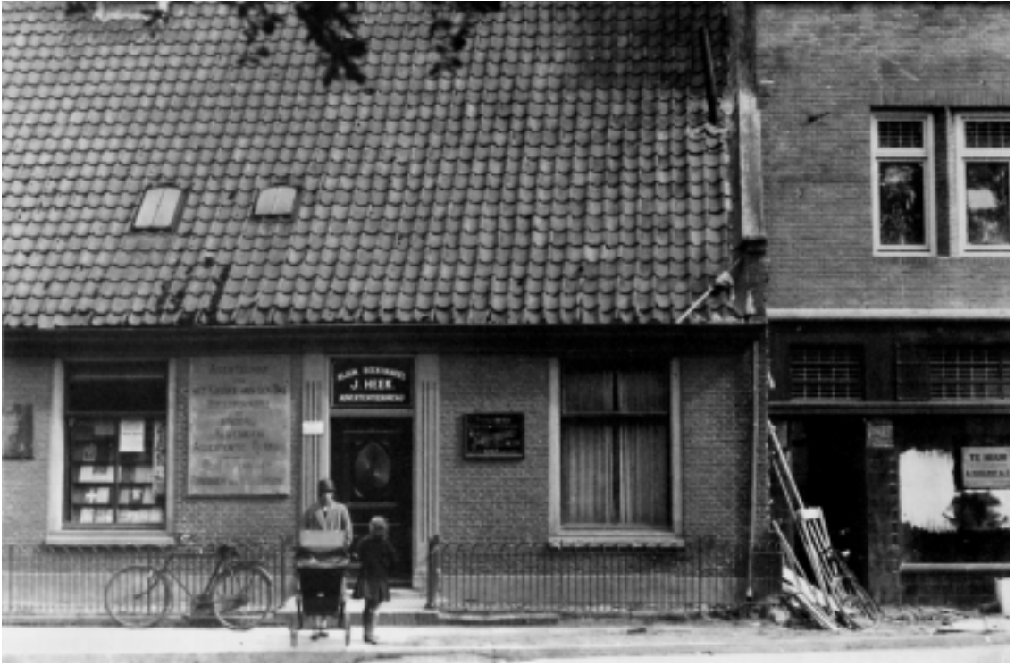
Kerkbrink 27, waar Heek zijn hele leven zou blijven wonen en werken, met rechts de voormalige bakkerij van Das. Schuin tegenover woonde de bekende apotheker/tandarts A.J. van Heemskerck Düker.

derbreking voor de man die door de buitenwacht als een boekenwurm en een kluizenaar werd beschouwd.