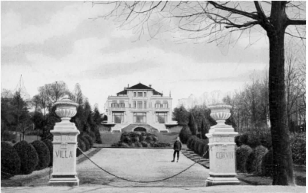
Briefkaart Villa Corvin.