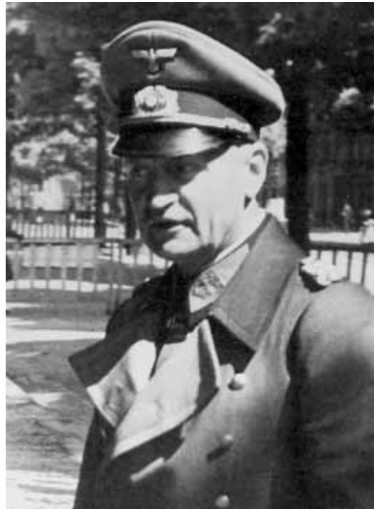
Blaskowitz tijdens een bezoek aan Parijs in mei 1944.

In het Interbellum deed Blaskowitz dienst in verschillende staven en was hij commandant van verschillende eenheden. In 1938 kreeg hij de rang van General der Infanterie en werd hij bevelhebber van Heeresgruppe 3 , waarmee hij maart 1939 Tsjechoslowakije binnentrok. In oktober 1939, na de Duitse inval in Polen, werd hij aangesteld als Oberbefehlshaber Ost en kreeg het bevel over de Duitse troepen in Polen. Zijn voorganger daar, Von Rundstedt, werd naar de westgrens van Duitsland