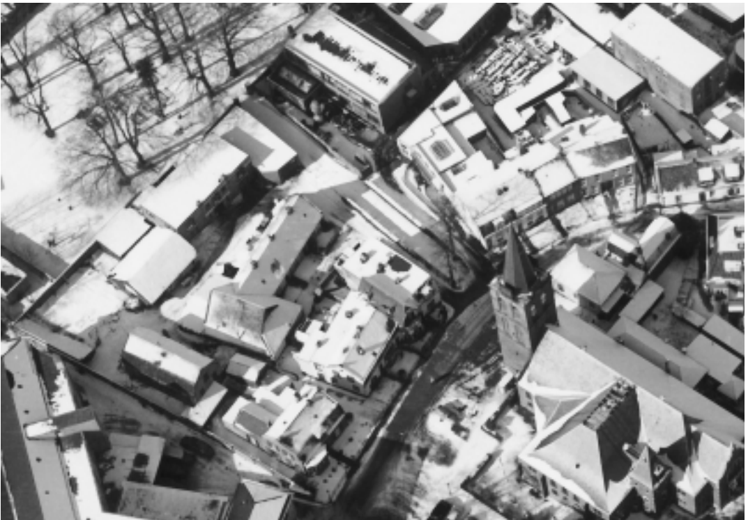
Luchtfoto uit omstreeks 1955 van de Grote Kerk en de Oude Torenstraat.

Waarom we anderhalf jaar na mijn geboorte de Oude Torenstraat verlaten hebben weet ik eigenlijk niet. Misschien vond mijn vader het leuk om eens