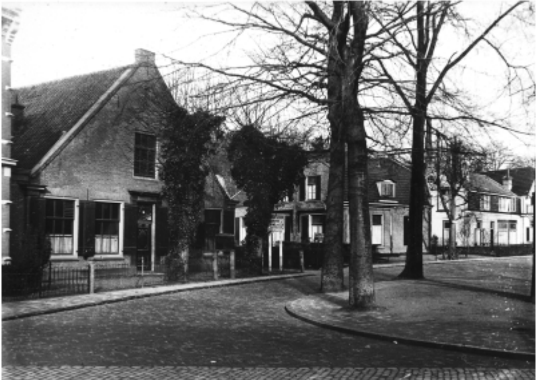
Het fabriekershuis van K. Perk Vlaanderen omstreeks 1930. De "twee geschoren boompjes" zijn inmiddels flink uit de kluiten gewassen. Hier staat nu het postkantoor. Achter de drie bomen is het huis van dokter Berg zichtbaar. Rechts op de foto is het pand waar grootvader Brom woonde.

van dokter Berg. Door die fabriek had de dokter maar een klein achtertuintje. Op het terrein had grootvader zes of zeven huisjes voor zijn arbeiders gebouwd. Er was ook nog ruimte nodig voor de opslag van de bomen die in de zagerij tot timmerhout verwerkt werden. De oprit naar de houtopslag en fabriek liep van de Oude Torenstraat langs ons huis en ik zie nog die lorries met zware paarden voor me die de bomen aan kwamen slepen. Binnenin die fabriek vond ik het ook reuze spannend, maar ik mocht er alleen maar in als de machines stil stonden.