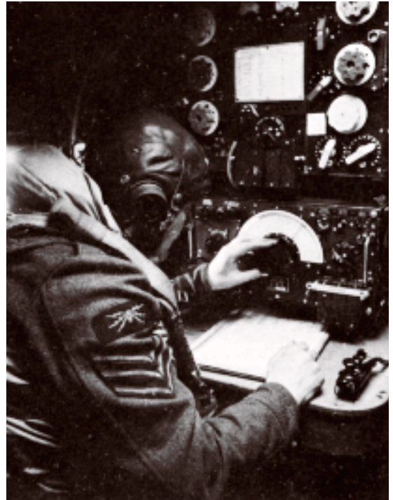
De radiotelegrafist aan boord van een Lancaster. Hij zit net achter de navigator (een deel van de apparatuur zoals peilontvangers is voor gezamenlijk gebruik) tegen de linkerwand van het toestel, met zijn gezicht naar voren. Let ook op het 'vonken'-embleem op zijn arm. (foto 207e Squadron, mei 1943)

De Lancaster werd ontworpen door Roy Chadwick van de vliegtuigfabriek A.V. Roe als een verbeterde versie van de tweemotorige Manchester. Het toestel maakte in januari 1941 zijn eerste vlucht en kwam in december van dat jaar in gebruik bij de squadrons. De eerste echte operationele vlucht vond in maart 1942 plaats. Het toestel is voorzien van vier Rolls Royce 'Merlin'-motoren die ook gebruikt werden in jachtvliegtuigen als de Spitfire. De motoren hebben in totaal een vermogen van ca 6500 pk, wat de Lancaster een kruissnelheid van 155 knopen (290 km/u) geeft. Het maximale startgewicht is bijna 30.000 kilo, waarvan maximaal 4000 kilo aan bommenlast. De spanwijdte is ruim 31 meter, de lengte ruim 21 meter. Het toestel heeft een dubbele staartvin. In de tanks gaan een kleine 10.000 liter brandstof dat het toestel met een gemiddeld gebruik