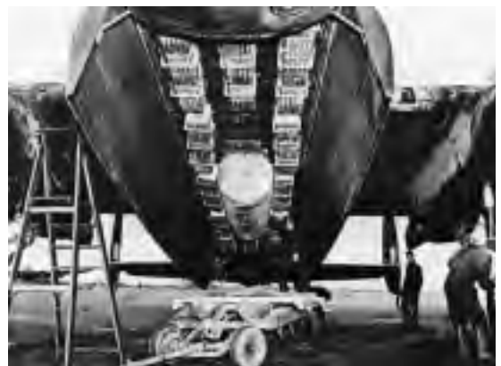
Een typische bommenlading voor een 'area-bombing' in 1943. In het midden de 1000 kilo zware, hoogexplosieve 'cookie'. De doosjes ernaast zijn de 'small bomb containers', die de brandbommetjes bevatten. (foto 207e squadron, mei 1943)

Dan volgt de meteo-officier, die de weergegevens geeft. Boven Engeland is het zwaar bewolkt. Maar de bewolking zal boven de Noordzee breken, terwijl het boven het continent nagenoeg wolkenloos is. Het zal dus zaak zijn goed naar Duitse nachtjagers uit te kijken. Boven het doel zal het ook onbewolkt zijn, op wat cirrusbewolking na. Het zicht zal er vrij goed zijn, er is alleen