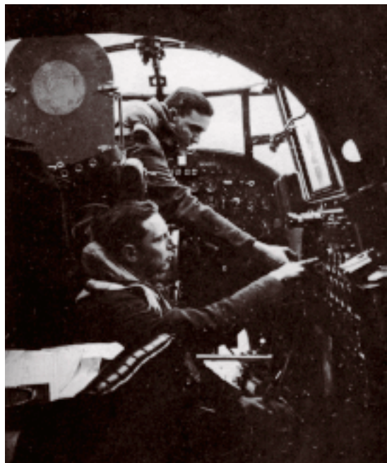
Piloot en boordwerktuigkundige tijdens het doorlopen van de 'checklist'. Op de voorgrond is nog net de stoel van de navigator te onderscheiden.