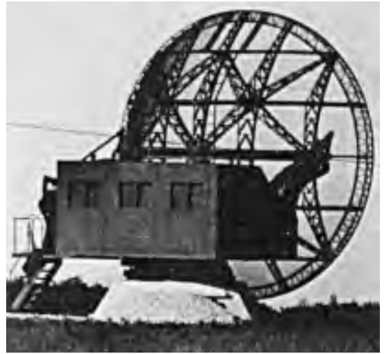
Eén van de antennes van de Duitse Würzburg-radar op Walcheren, waarmee de Duitse nachtjagers naar de geallieerde bommenwerpers gestuurd worden.

De andere 25% viel als slachtoffer van de Flak, de Flugzeug Abwehr Kanonen . Deze kanonnen werken in combinatie met zoeklichten. Langs de Nederlandse kust is er een hele gordel van deze kanonnen, alhoewel er in die gordel 'gaten' zitten, waardoor Engelse bommenwerpers relatief veilig het vijandige luchtruim kunnen binnendringen. Verder inlands zijn er meer Flakstellingen, o.a. rondom Amsterdam en Utrecht. In Duitsland zelf zijn zware Flakstellingen geconcentreerd rond de grote steden, ter verdediging tijdens bombardementen. Het zijn deze Flakstellingen die de Engelse vliegers de meeste zorgen baren. Normaal gesproken