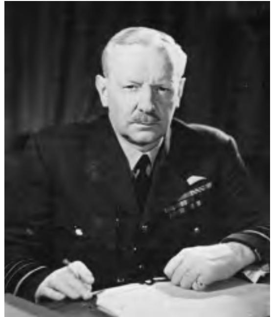
Sir Arthur Harris, vanaf februari 1942 commandant van 'Bomber Command'.

De operationele commands zijn onderverdeeld in groepen, die op hun beurt weer onderverdeeld zijn in squadrons, de kleinste zelfstandige gevechtseenheid binnen de RAF. Zo behoort ons 207de squadron tot groep 5 van Bomber Command van de RAF. Het is één van de oudste RAF-squadrons; het werd al gevormd in november 1916. Opgemerkt moet nog worden dat veel taken binnen de RAF door zowel mannen als vrouwen uitgevoerd worden. Zo zijn er bijvoorbeeld veel vrouwelijke vliegtuigmonteurs. En vrouwelijke vliegtuigbe'man'ningen van de WAAF (Womens Auxiliary Airforce) vliegen toestellen van de fabriek naar de squadrons. Operationele vluchten zijn echter, wegens het gevaar dat eraan verbonden is, voorbehouden aan mannen.