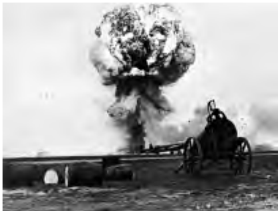
Foto van het verongelukken van een Lancaster tijdens de start. Dit toestel had dezelfde bommenlading aan boord als het vliegtuig van Hawkes. Een dergelijke paddestoelwolk, het gevolg van het ontploffen van een 'cookie', heeft er waarschijnlijk ook boven het Rode Dorp gehangen.

vliegen, waarna het op zeer geringe hoogte ongeveer de Vaartweg volgde. Om vijf over twee, het toestel is dan precies boven het Rode Dorp, komt de 1000 kilo zware explosieve bom tot ontploffing. De detonatie is mogelijk het gevolg van de brand aan boord, mogelijk ook is de vertraagde ontsteking alsnog afgegaan. De Lancaster EM-G desintegreert met een enorme explosie en laat een spoor van kleine en grote brokstukken op de grond achter.