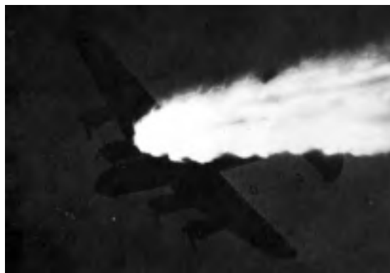
Een in brand geschoten Lancaster, gefotografeerd vanuit een collega-bommenwerper.

Het is hem echter niet toegestaan om boven bezet gebied de bomlading uit te werpen om het toestel lichter te maken. Dat Hawkes dit ook inderdaad niet gedaan heeft, lijkt erop te wijzen dat zijn vliegtuig nog redelijk bestuurbaar was. Wat er kort voor Hilversum verder met het toestel gebeurt, is niet bekend. Mogelijk werd Hawkes voor de tweede keer door een Duitse nachtjager beschoten. Andere vliegtuigbemanningen hebben kort voor 2 uur een Junkers 88 in de buurt van Hilversum gesignaleerd. Ook is het mogelijk dat het vliegtuig na ruim 20 minuten nog in de lucht te zijn gebleven, alsnog in brand is geraakt. Getuigen hebben het toestel in ieder geval brandend over het centrum van Hilversum zien