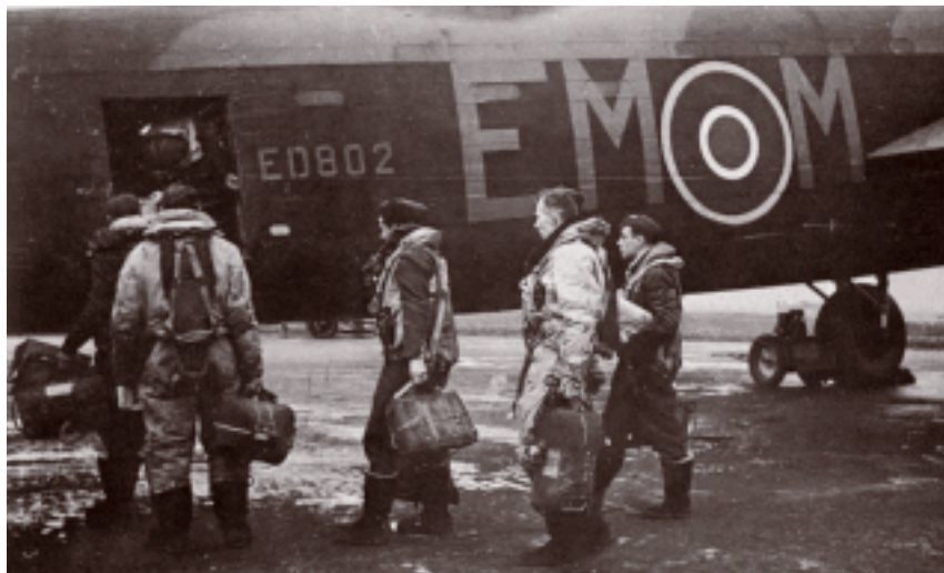
Een bemanning klimt aan boord voor weer een nieuwe vlucht. Lancaster ED 802 van het 207e squadron (letters EM), mei 1943. Het toestel is van hetzelfde type als Hawkes' machine. De hier getoonde bemanning heeft de bemanning van Hawkes waarschijnlijk goed gekend.

Verder halen ze hun pakketjes boterhammen en enkele thermosflessen thee en koffie op. En na het aantrekken van dikke vliegoveralls is het verder wachten op het moment van vertrek. In het wachtlokaal nemen ze met de andere bemanningen de komende vlucht nog even door, wisselen nog wat tips en ervaringen uit of leggen een kaartje. Een klein half uur voor vertrek rijdt dan de bus voor, die de bemanningen naar hun vliegtuigen zal brengen die verspreid op het vliegveld staan opgesteld.