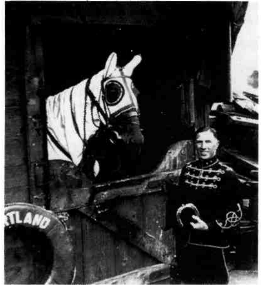
Charles Pahud de Mortanges (1896-1971) met zijn paard Marcroix, waarmee hij in 1924, 1928 en 1932 gouden medailles won.

Evenals nu het geval is was de aanloop naar de Spelen van '28 lang. Reeds in 1923 moest het Nederlandsch Olympisch Comité (NOC) harde toezeggingen doen om de Spelen naar ons land te krijgen. Die toezeggingen hadden vooral betrekking op de financiering van het evenement en dat was niet eenvoudig geweest. Een voorstel voor een bijdrage in de kosten was in de Tweede Kamer verworpen. Amsterdam moest het zelf maar opknappen. Daar zag men het belang van de Spelen voor Amsterdam wel in. Het gemeentebestuur stelde a fonds perdu een half miljoen gulden beschikbaar en schreef ten laste van Amsterdam een premielening van vijf miljoen uit, wat toentertijd vrij grote bedragen waren. De lening was snel voltekend en in feite waren het dus