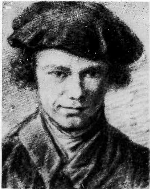
Ongedateerd portret van Barend Koekkoek.

Na zijn succes op de verkooptentoonstelling in Amsterdam nam James met nieuw werk in 1825 deel aan tentoonstellingen in het Paviljoen 'Welgelegen' (nu in gebruik als Provinciehuis) en ook in het Teylersmuseum, het oudste museum van Nederland, beide gevestigd in Haarlem. In Willem I had het jonge koninkrijk een overtuigend stimulator van alle kunst van die dagen. Het was de koning zelf die de aanzet gaf tot de stichting in het Paviljoen in Haarlem van een 'Kunstgalerij der Werken van Levende Nederlandsche Meesters'. Na 1835 echter diende het Paviljoen alleen