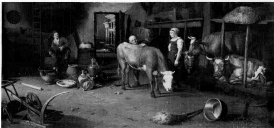
James de Rijk, Boerendeel met koestal (fragment) , ongedateerd (coll. Gemeente Amsterdam).

wij met deze droomwereld vol hunkering en nostalgie niet zo goed raad meer. Of toch nog wel? Het oeuvre van deze schilders beleeft juist nu een weer groeiende belangstelling. De Romantici trekken steeds meer bewonderende kijkers op tentoonstellingen en grage kopers op kunstveilingen.