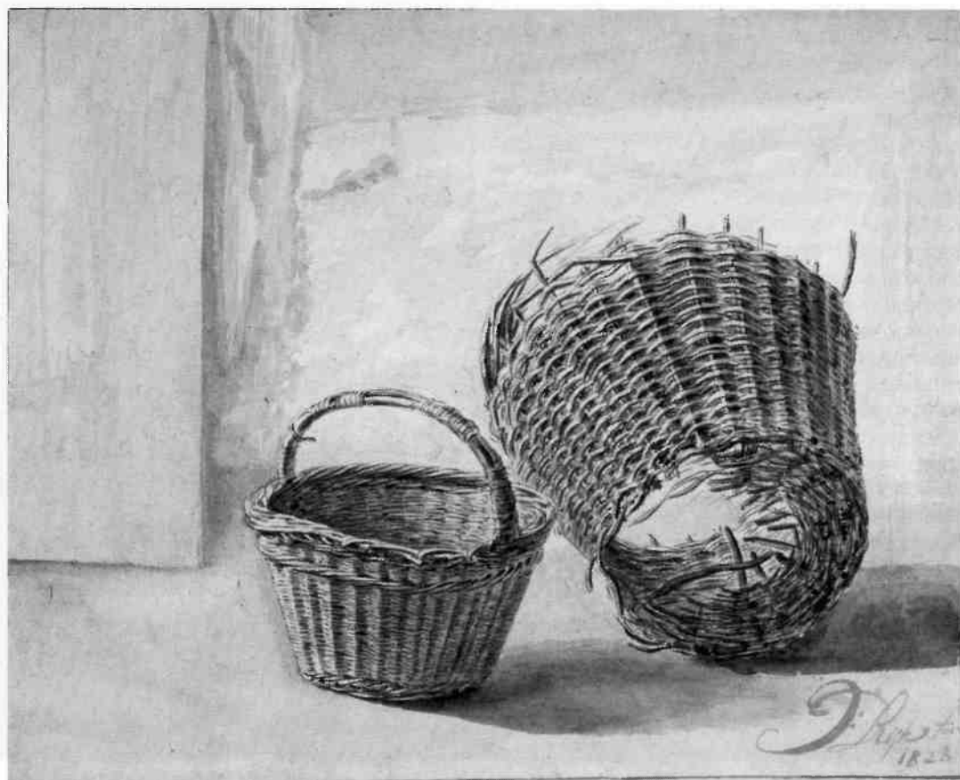
Studieblad met manden door James de Rijk (1823) (coll. F. Renou).

atelier dienden zij als voorbeeld en sjabloon en zo werden in natuurgetrouwe kleuren fantasie-landschappen gecomponeerd die een bevallige schijn van de werkelijkheid toonden. Tot in de kleinste details – met ragfijne penselen – werd alles netjes op doek of paneel overgebracht en daarna moest het werkstuk nog glad als een spiegel worden afgelakt. Dat was de doorsnee smaak van die dagen: herkenbaarheid, sfeer en technische perfectie. De schilderkunst bleef een reproductie- en atelierkunst. De naar de natuur gemaakte schetsen werden goed bewaard in mappen om zo opnieuw voor andere arrangementen dienst te kunnen doen.