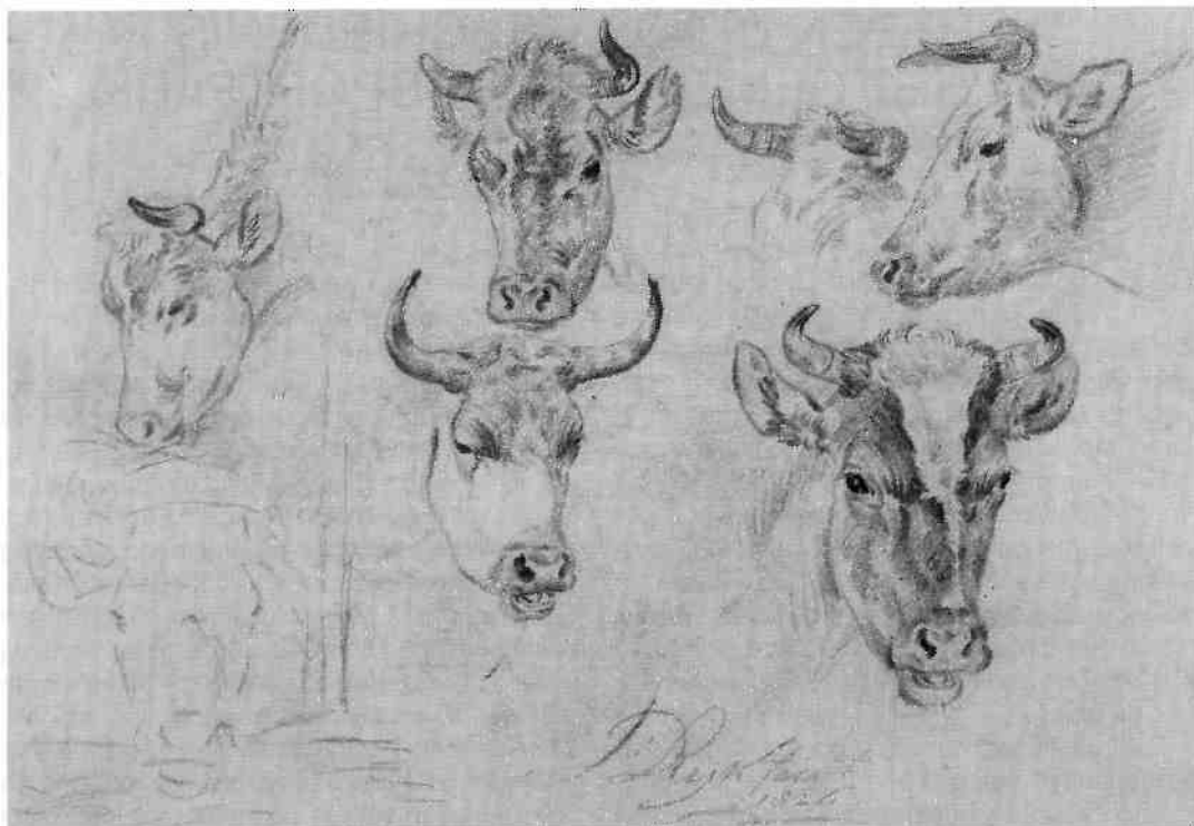
Studieblad met koeiekoppen door James de Rijk (1826) (coll. F. Renou).

den gesproken. De leden betaalden een jaarlijkse contributie van zo'n honderd gulden.