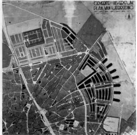
Afb. 3 (links). Schema ontwerp uitbreidingsplan, ca. 1918.