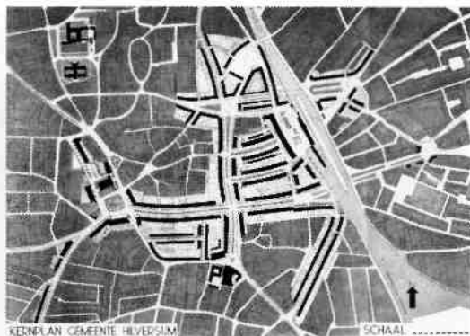
Afb. 5. Kernplan, 1946.

Niettemin achtte hij het tactischer, van het bestaande dorpsplan uit te gaan; met name van het stelsel van hoofdwegen en eerst de gevolgen van de noodzakelijke verbreding van deze stra-