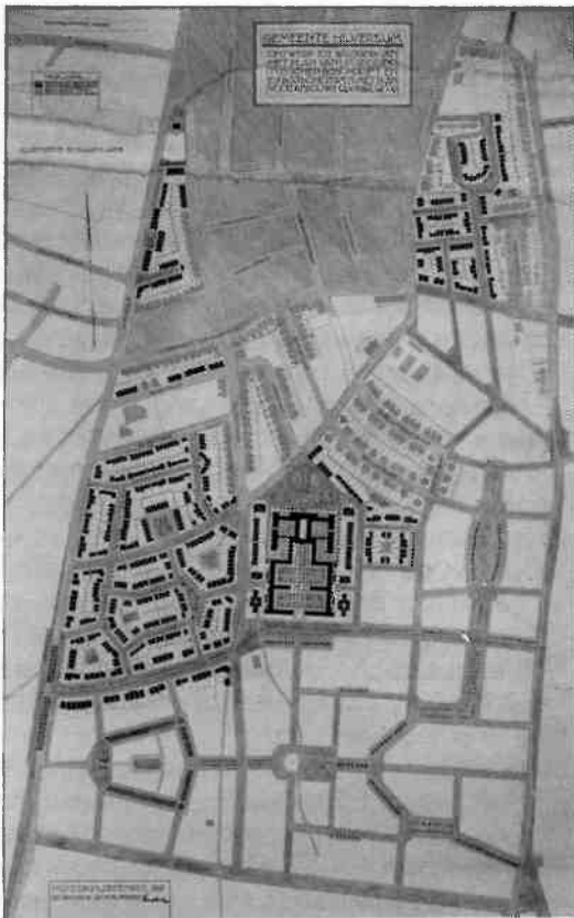
Afb. 1. Ontwerp tot wijziging van het plan van uitbreiding tussen de Bosdrift en de Eikbosserweg met bebouwingsplan, 1915 (coll. SAGV).

bemoeien. De stad had namelijk dringend behoefte aan nieuwe arbeiderswijken.