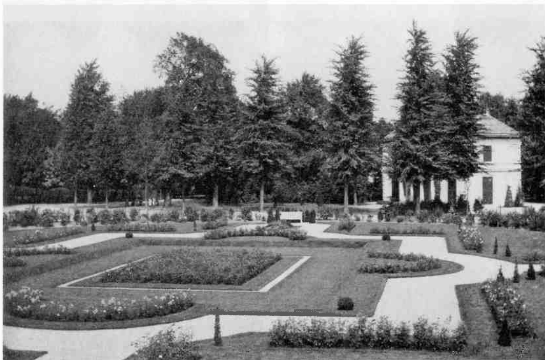
Voor de plaats van het definitieve verzetsmonument had het voorbereidingscomité vanaf het begin het oog op het Rosarium aan de Boomborglaan. Om het beeld goed tot zijn recht te laten komen, diende het verlaagde middendeel van dit plantsoen te worden opgehoogd (foto: Goois Museum).

Enkele dagen later kwam stadsarchitect Dudok met een advies voor de plaats van het monument. Na overleg met het Comité meldde Du-