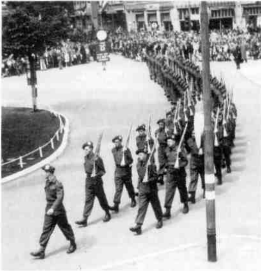
Vanaf de 's-Gravelandseweg kwam kort voor drie uur op 6 juni 1945 een afdeling van de "Red Devil" divisie aange-marcheerd voor de plechtigheid op de Kerkbrink.

De onthulling van het monument (geheel rechts) vond plaats door een Nederlandse vlag weg te nemen. Tegelijk gingen – onder het geloei van sirenes – de vlaggen van Engeland, Nederland, de Verenigde Staten en Canada halfstok.