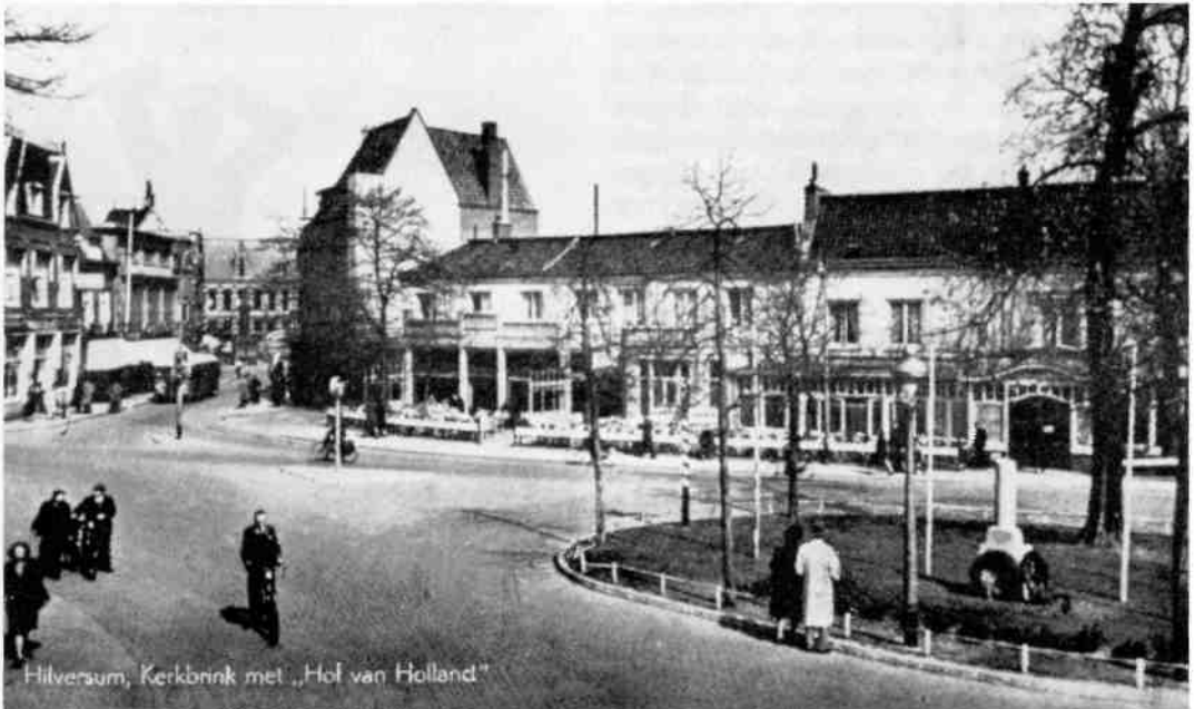
Ondanks de onthulling van het definitieve verzetsmonument moet het D-Day gedenkteken nog een poosje zijn blijven staan. Deze foto dateert w.s. uit voorjaar 1950. Ook toen werden kennelijk nog kransen gelegd bij dit monument. Kort hierna is het monumentje spoorloos (?) verdwenen.

in zijn antwoord afstand te nemen van de opvattingen van Verlinden en zijn achterban.