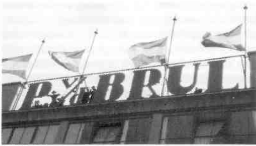
Ook op het dak van het kledingmagazijn P. v/d Brul op de plaats van het huidige "gat" werd gedurende de plechtigheid halfstok gevlagd.

Links onder: oud en jong maakten van de gelegenheid gebruik om bloemen te leggen bij het monument. Rechts onder: het monument na de plechtige onthulling. Een bloemenzee als stille hulde aan de gesneuvelden. De tekst in het Engels eerde zowel de gevallen verzetsstrijders als die van de geallieerde legermacht. De 'afgebroken' zuil symboliseert het abrupt beëindigde leven.