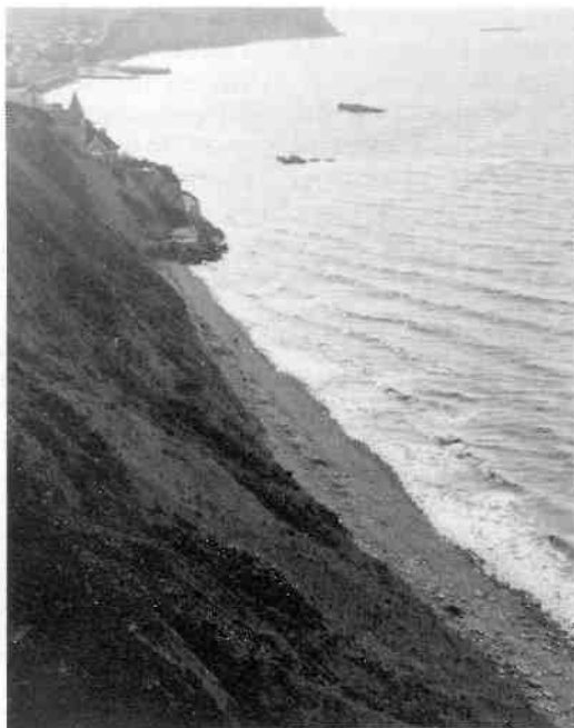
Gold Beach bij Arromanches in Normandië, waar op 6 juni 1944 vooral Britse troepen aan land gingen. Enkele pontons in zee herinneren aan de grote kunstmatige haven die kort na de invasie op deze plaats werd aangelegd.

Het lag daarom voor de hand om in de bevrijde gebieden monumenten op te richten ter ere van diegenen die hun leven voor onze vrijheid