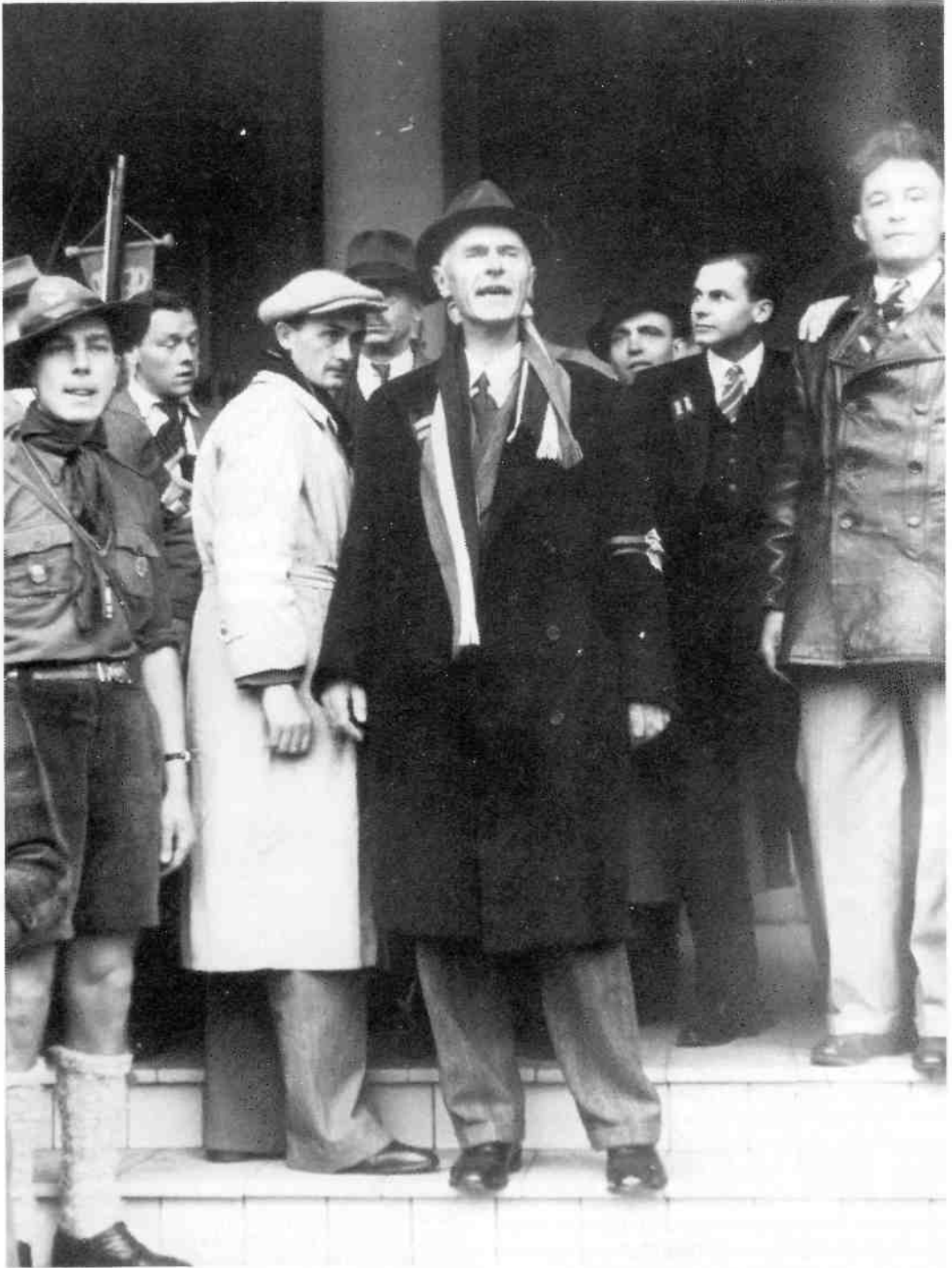
Overste Schrek spreekt vanaf het bordes van hotel "Gooiland" de Hilversummers toe tijdens de bevrijding op maandag 7 mei 1945. De twee bandjes op de rechter rever van zijn overjas, geven de functie aan van districtscommandant BS.