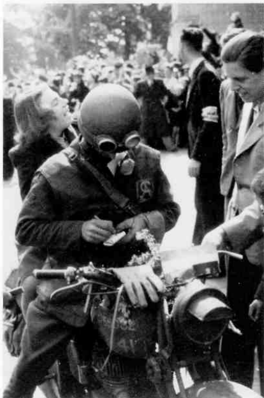
Enthousiaste Hilversummers voor Goiland. Een Britse motorkoerier deelt handtekeningen uit. Een jonge vrouw heeft zich verzekerd van een mooi plekje achterop de motorfiets.

Hier eindig ik mijn verslag, doch niet voordat