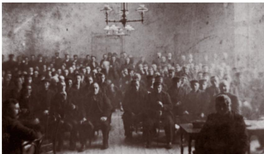
Eén van de weinige historische foto's van het interieur van Hof van Holland. Hier vergadert de "Nieuwe Partij" van ontevreden Erfgooiers in 1912.