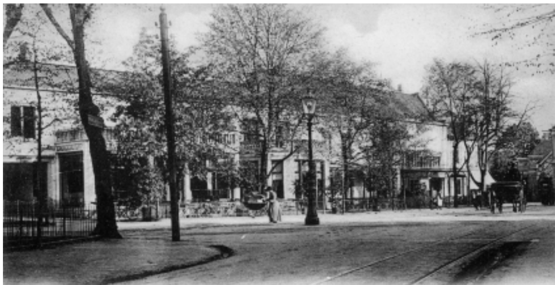
De oudste afbeelding van het gehele Hof van Holland-complex uit 1900. De bovenverdieping van het linker deel werd benut voor hotelkamers, die van het rechter deel was het woonhuis van de hotelier.

de Emmastraat. Het was bovendien de ontmoetingsplaats van veel omroepmedewerkers. In de oorlog werd er in 1942 een illegale telegrafiezender ingericht voor het doorgeven van berichten van het verzet aan Engeland. Na de oorlog maakten vooral de eerste televisie-demonstraties naam.