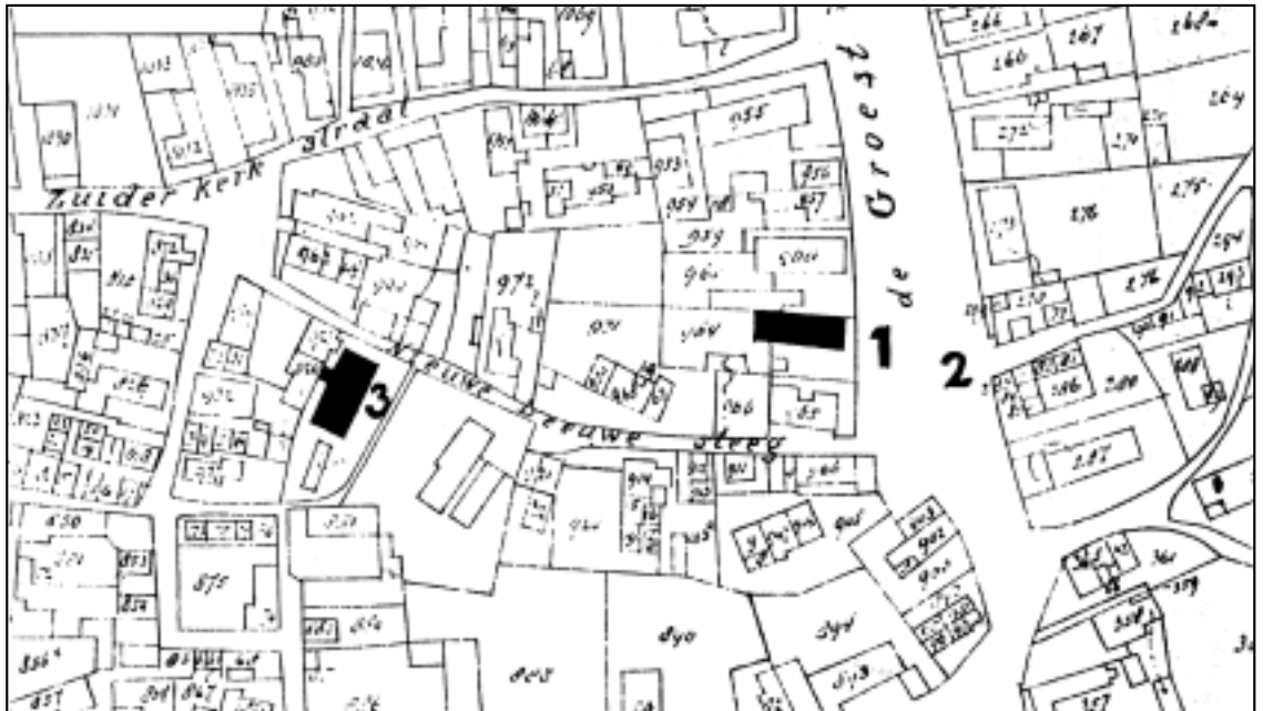
Fragment van de kadastrale kaart uit 1824. Betekenis van de nummers: 1=Groest 110; 2=omgeving Smidsteeg; 3=Veerstraat 29-31. De Nieuwe Leeuwesteeg is de huidige Veerstraat, terwijl de Zuiderkerkstraat de huidige Herenstraat is (n.b. de huidige Kerkstraat heette destijds de Noorderkerkstraat). De doorbraak van de huidige Prins Bernhardstraat bestond in 1824 nog niet.

bruiken. In de notariële akte wordt niets gezegd over eventuele schade door de dorpsbrand die in dit huis begon. Hieruit valt voorzichtig af te leiden dat de schade aan zijn huis beperkt was gebleven. Of de schade in deze korte tijd hersteld was, of dat het uitgebrande gedeelte van het huis eenvoudig was afgebroken is niet duidelijk.