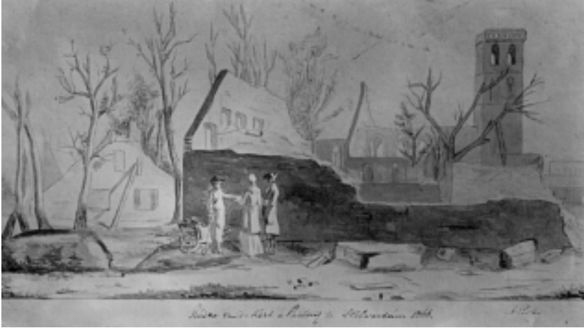
De resten van de gereformeerde pastorie met de ruïne van de Grote Kerk op de achtergrond, gezien vanuit de Oude Torenstraat bij de hoek 's-Gravelandseweg. Tekening Albertus Perk, 1815. (coll. Goois Museum)

men gemaakt. Het vuur trok langs de Herenstraat en de Langestraat naar de Schoutenstraat, de Kerkbrink en de Oude Torenstraat. Aan blussen viel niet meer te denken. Toen 's avonds de brand uitgewoed was, kon de schade opgenomen worden.