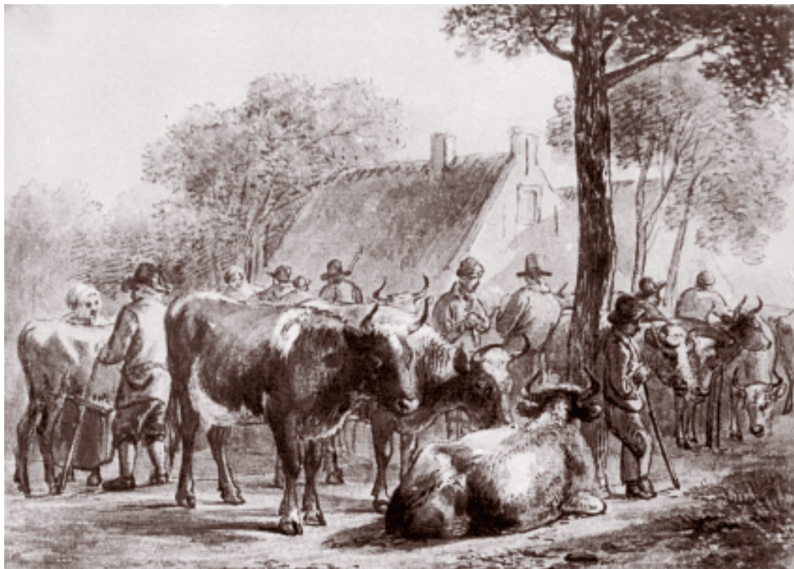
De Hilversumse koemarkt op de Groest. In Hilversum waren de joodse slagers tevens handelaren in vee. Aquarel van J. van Ravenswaay. (coll. Goois Museum)

Uit niets blijkt dat er speciale maatregelen genomen werden tegen Hartog Michielse Levie. Er is voor het ge-