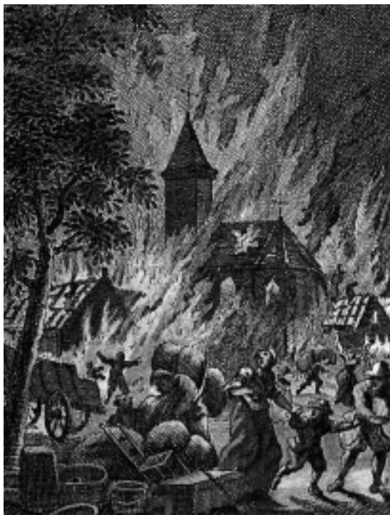
De chaos in Hilversum tijdens de dorpsbrand van 1766. Gravure uit Geschiednissen der Vereenigde Nederlanden voor de Vaderlandsche Jeugd, 1789. (coll. Goois Museum)

Op woensdag 25 juni 1766 werd bij een joodse slager aan de Groest vet gesmolten in het achterhuis. Er moet toen iets mis zijn gegaan. Tegen twee uur die middag is door onbekend gebleven oorzaak brand uitgebroken in dat achterhuis. Door de straffe zuidoosten wind van die dag verspreidde het vuur zich razendsnel. De warme, droge zomer had van de veelal houten huizen met rieten daken een gemakkelijke prooi voor de vlam-