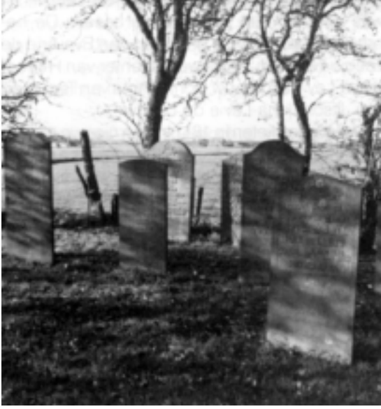
De Israëlitische Begraafplaats aan de Koninginneweg te Kortenhoef. Tussen 1859 en 1940 vonden 23 's-Gravelandse joden, voor het merendeel leden van de familie De Leeuw, hier hun laatste rustplaats. Deze grafstenen zijn de laatste stille getuigen van de verdwenen joodse gemeenschap van 's-Graveland.