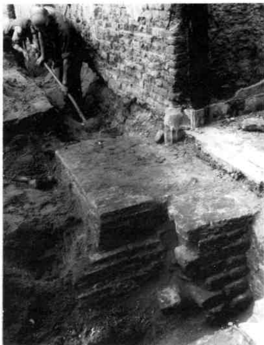
Fundamenten van een 13e-eeuwse kapel op de Kerkbrink. Deze kloostermoppen zijn rechts op de foto te zien, het blok bakstenen erachter is een 18e-eeuws pilaarfundament van de herbouw van de kerk na de grote dorpsbrand. Op de achtergrond de muur van de 15-eeuwse toren.