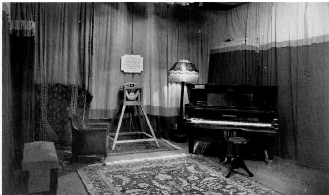
H.D.O.-studio op het N.S.F.terrein aan de Jan van der Heijdenstraat te Hilversum. Midden: electro-magnetische microfoon type Sykes-Round, opgehangen in een verrijdbare standaard.