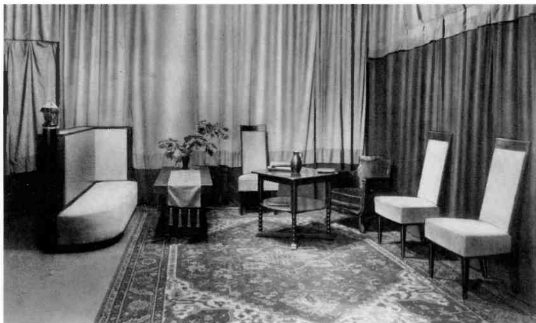
H.D.O.-studio op het N.S.F.terrein, met Dudokmeubilair (circa 1925)