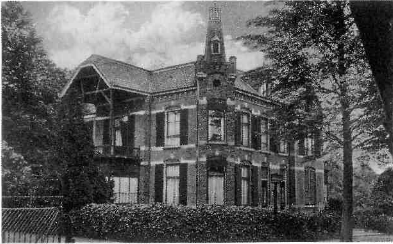
Exterieur van het pand Witte Hullweg 1-3. In 1928 gesloopt in verband met de bouw van het raadhuis.

de opdracht het AVRO-complex aan de 's-Gravelandseweg vorm te geven. In de nieuwbouw is echter geen plaats meer voor het Dudok meubilair. Uit navorsing blijkt, dat de vanuit kunsthistorisch oogpunt belangwekkende creaties van de Hilversumse stadsbouwmeester naar alle waarschijnlijkheid een triest einde op de vuilnisbelt vonden.