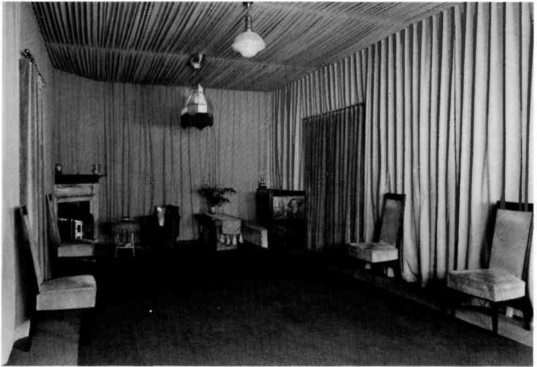
AVRO-studio, ook wel 'Radio-bonbonnière' genaamd, Oude Enghweg 4 te Hilversum (1928).