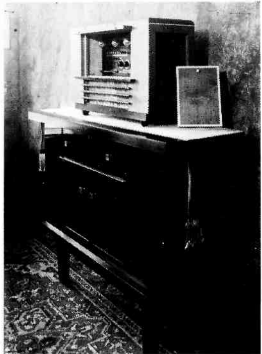
Dit koninklijk geschenk wordt op 30 april 1925 door de N.S.F. aangeboden aan prinses Juliana t.g.v. haar zestiende verjaardag: het 'Koninginnetoestel'. Ontwerp toestelkast en buffet: W.M. Dudok.

Ter gelegenheid van de zestiende verjaardag van Prinses Juliana op 30 april 1925 besluit de NSF-directie een koninklijk geschenk, in de vorm van een radio, aan te bieden. Het toestel,