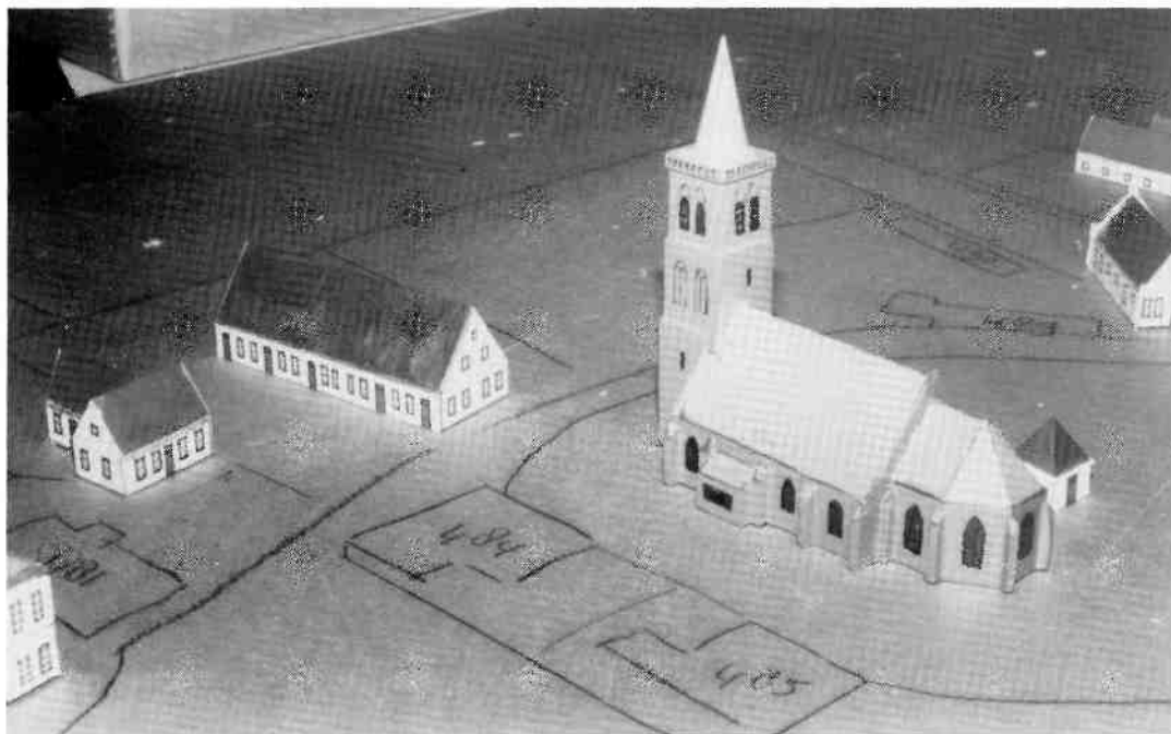
De maquette in wording. Het ruwe stratenpatroon rond de Kerkbrink met de nog onvoltooid Grote Kerk.

Voordat de geveltjes echter getekend konden worden, moest eerst het oppervlak van het huis, c.q. de plattegrond opgemeten worden (met een schuifmaat, op tienden van millimeters nauwkeurig), omgerekend worden naar onze schaal en op de systeemkaart ingetekend. Dit vormde de basis voor verdere verwerking en fabricage van het huisje uit een blokje hout (essehout, want dat is heel vlak te schuren en bevat nauwelijks