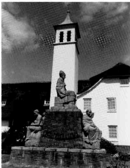
Rechts: het klooster De Stad Gods met kapel (links) en toren. Vóór dit alles staat een beeldengroep gemaakt door Zr Van der Lee.

Onder: de in 1901 gebouwde stalling voor paard en wagen werd later een garage met chauffeurswoning. Deze foto is van april 1988. Inmiddels zijn hier door de stormen van januari en februari 1990 veel bomen verdwenen.