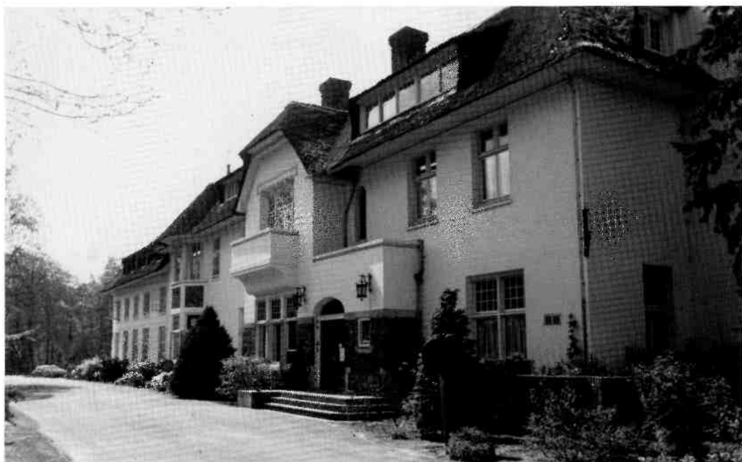
De oorspronkelijke villa Monnikenberg, ontworpen door architect J.F. Klinkenberg en gebouwd in 1900. Deze opname werd gemaakt tijdens de excursie van 28 april jl.

(vaak gelezen als Felders). 15 Ook hij liet veel (ver)bouwen. Zo werden er een autogarage, paardenstal, chauffeurswoning, speelruimte en fietsenberging opgericht of verbouwd 16