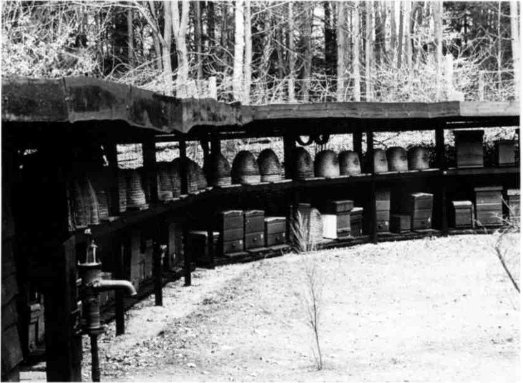
In de bijenschans in het Corversbos dicht bij de voetgangerstunnel aan de Schuttersweg leeft de traditie van de bijenteelt in Hilversum en omstreken voort.

ven belasting te heffen over het bezit aan bijen of standplaatsen daarvoor. Aanvankelijk werd deze belasting of cijns in natura voldaan en zo is ze bekend geworden als 'was-tinse'. Later werd in contanten betaald en ontstond de naam 'stuiversgeld'. Dit geld kwam dikwijls ten goede aan de armen. Soms behielden de kerken het geheel of ten dele.