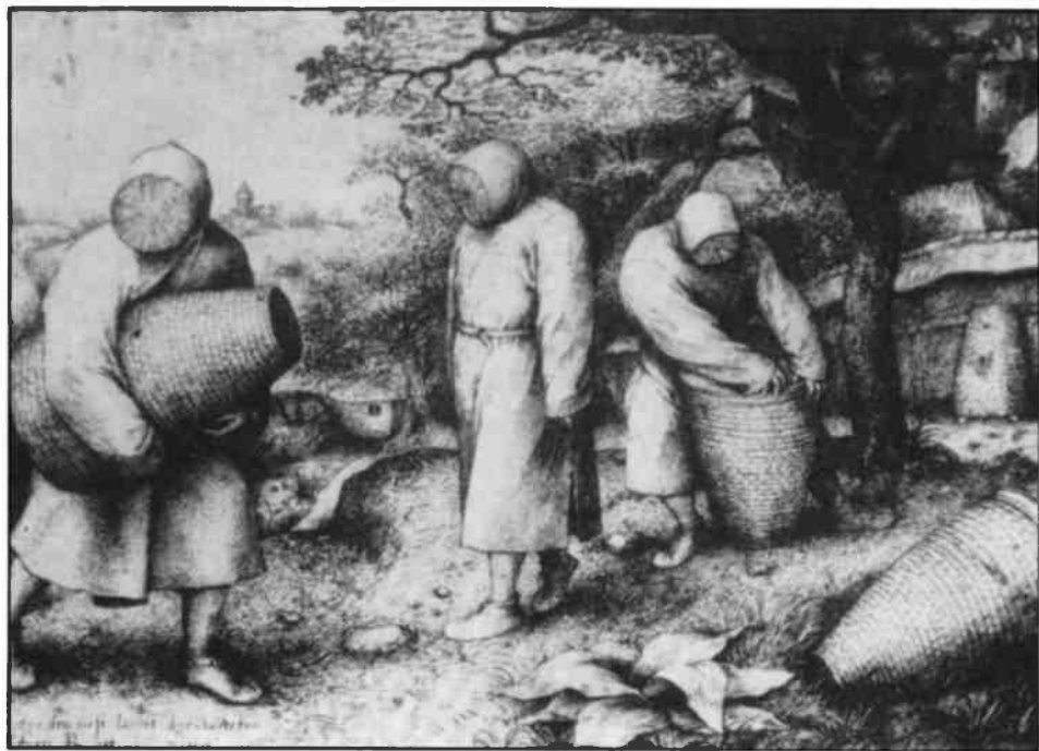
Imkers rond 1600.