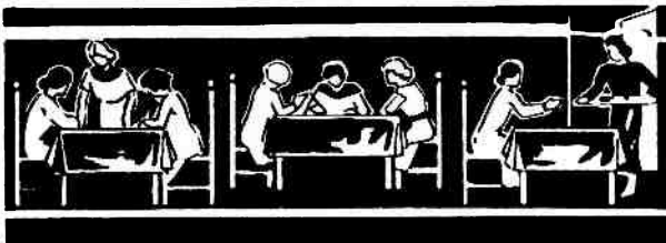
Het clubhuis, gelegen aan de 's-Gravelandseweg 60, bood ook slaapgelegenheid voor meisjes met een dagbetrokking.

Inlichtingen bij de Directrice 's avonds na half acht.