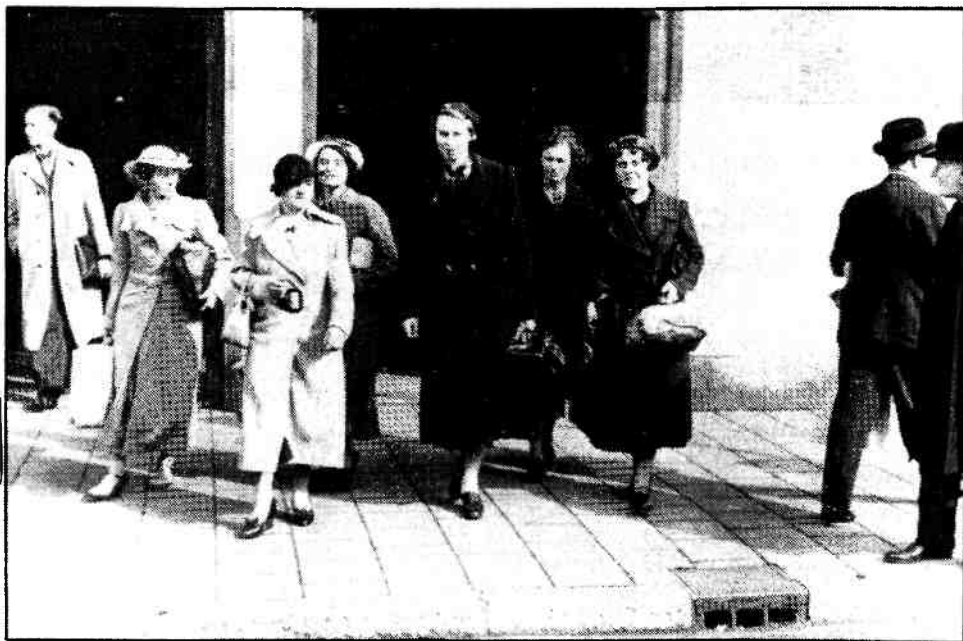
Op verschillende plaatsen in Nederland werd door vrouwelijke vrijwilligers stationswerk verricht. Net aangekomen meisjes, op zoek naar onderdak en werk, werden door hun op passende wijze geholpen. In Hilversum vond geen actief stationswerk plaats. Wel werden de net aangekomen meisjes via borden verwezen naar een betrouwbaar adres.

Door de internationale contacten van deze vrouwenorganisaties werden in Duitsland zelf de vrouwen al gewaarschuwd om voor vertrek naar Nederland eerst zo goed mogelijk in Duitsland, bijvoorbeeld bij hun kerk, te verifiëren of zij in Nederland wel juist terecht zouden komen 6 . Het gevaar, dat de Duitse vrouwen liepen om in Nederland in aanraking te komen met verkeerde mensen werd groot geacht. Behalve vrouwenorganisaties en kerken waarschuwde ook de Duitse politie de meisjes niet in handen te vallen van meisjeshandelaren 6 .