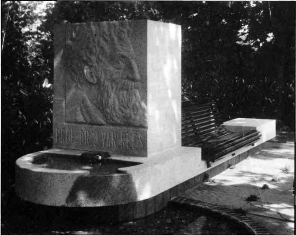
De Van Reesbank, gefotografeerd kort na de plaatsing in 1933.

Achter de zitbank is een bloembak, afgedekt met zwart-verglaasde Siegersdorfer gevel-deksteen. De bak is gevuld met blauwe bloemen (de kleur van de geheelonthouders). Voor de beeltenis is een klein, half cirkelvormig waterbekken met een straal van 0.75 M. in het graniet uitgehouwen. Het water loopt uit den uit de hand gehamerde bronzen spuer in een wijder, met rivierkeijtes bestraat bassin van enkele centimeters diepte, waardoor een spiegeling ontstaat en waaruit het water door een kolk wegvloeit. Rondom het overige gedeelte der bank is een perron van gemetselde paarse flagstones aangebracht''.