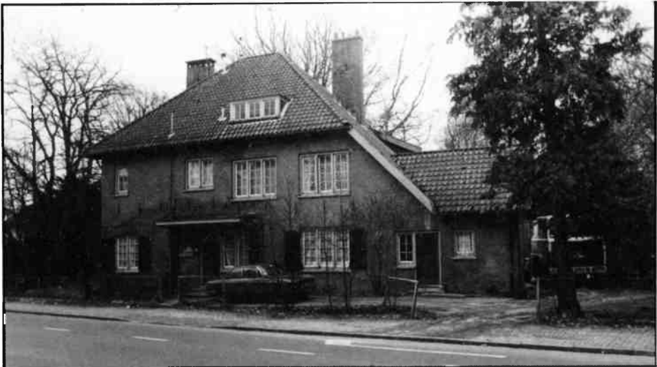
Van 1915 tot 1927 woonde van Rees op Godelindeweg 20.

In 1915 kwam van Rees opnieuw in Hilversum wonen in een huis aan de Godelindeweg nr. 20, dat in 1900 door de bekende Hilversumse architect J.W.Hanrath was gebouwd voor de heer P.W. van Anrooij.