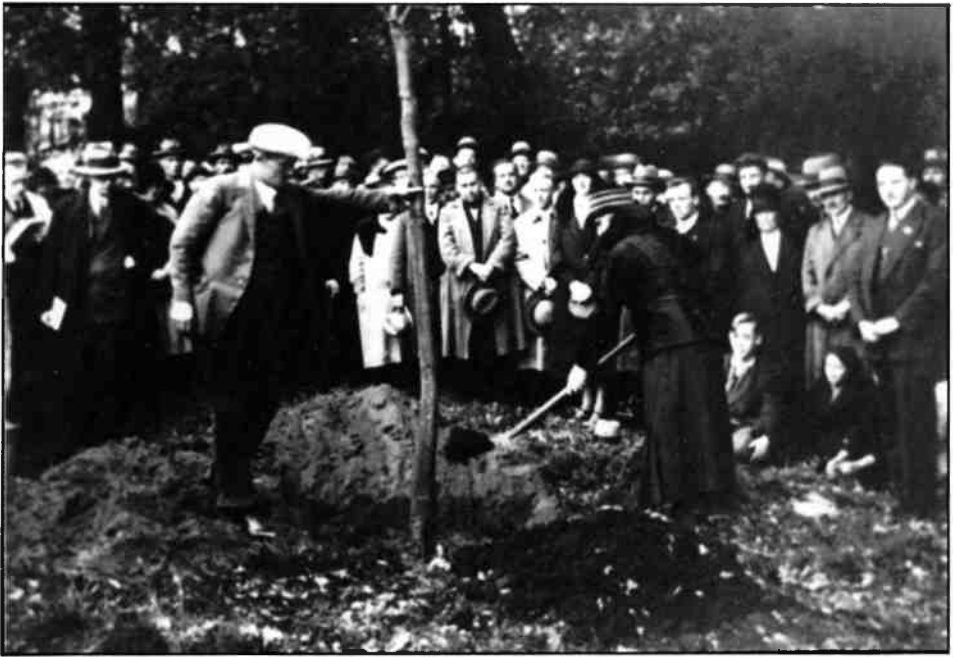
Het planten van een rode kastanje als eerbetoon aan van Rees op 17 oktober 1931.