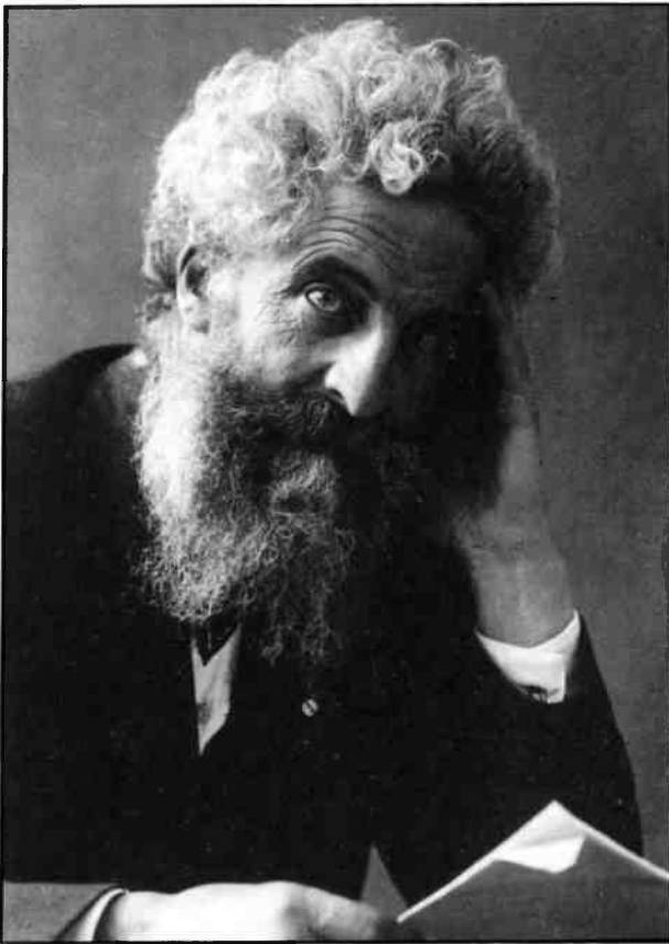
Jacobus van Rees.

In 1889 werd van Rees buitengewoon hoogleraar in de histologie (weefselleer) te Amsterdam na reeds drie jaar lector geweest te zijn. Deze jaren woonde hij, op korte verblijven in Napels en Freiburg na, in Amsterdam.