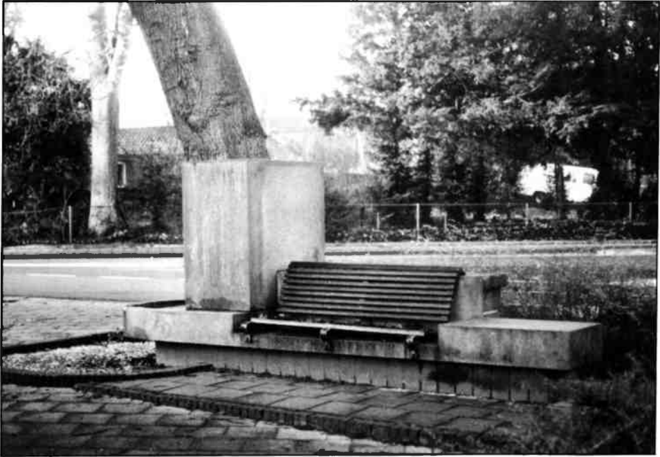
Thans staat de bank er verwaarloosd bij en is de zitting vernield. Een restauratie is zeker op zijn plaats.

Thans is een gelijke klacht en belofte op zijn plaats, aangezien dit monument er opnieuw verwaarloosd bijstaat.