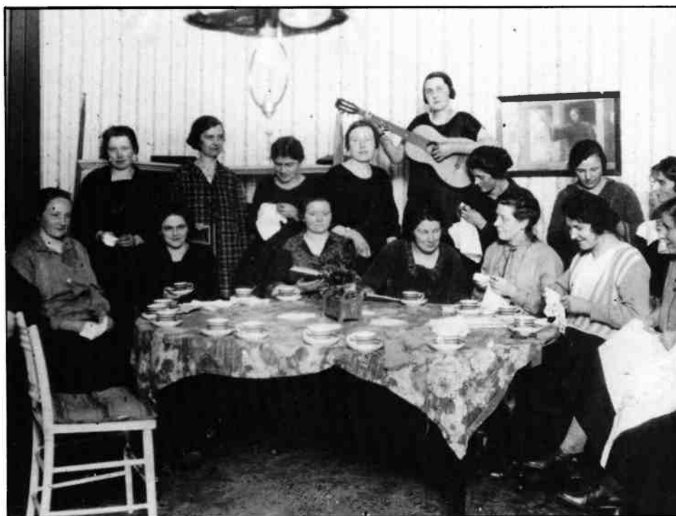
Gezellige avond voor Duitse dienstboden.