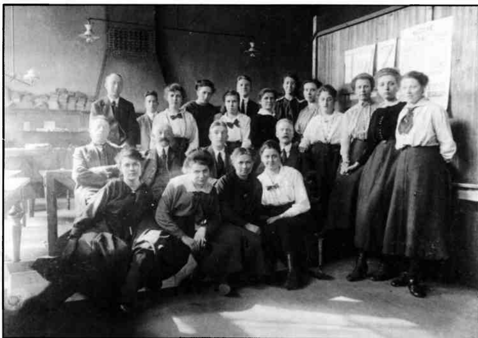
Ambtenaren van de Gemeentearbeidsbeurs van Hilversum. (circa 1930) Uit het jaarverslag van 1924 blijkt, dat in die jaren vrouwelijke ambtenaren aanwezig waren, die zich speciaal met de bemiddeling van vrouwen bezighielden.

in 1924 in het jaarverslag van de Gemeentearbeidsbeurs te Hilversum de terugloop van de Duitse dienstboden medeverantwoordelijk gesteld werd voor de verhoogde plaatsingskans van vrouwen boven de achttien jaar. 10