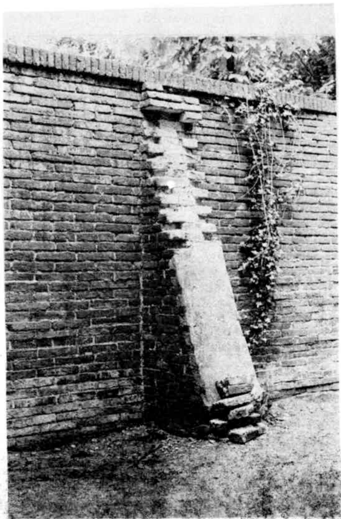
De muur is duidelijk aan herstel toe! (foto J.v.d.Sar, juli 1982)