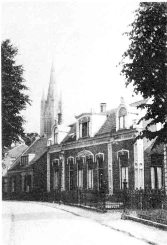
Veerstraat 23. De oude huizen links zijn afgebroken in 1932. De foto dateert uit 1925. (coll. De Vaart)

Veerstraat 23 : Het linkerhuis van een blok van twee, omstreeks 1875 gebouwde heren- of fabriekshuizen van de gebroeders Van der Heijden. Het huis heeft een, in Hilversum weinig voorkomende, rijk versierde voorgevel. Helaas is het door een recente brand (1979) ernstig aangetast.